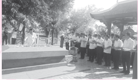
Đoàn cán bộ huyện Hương Sơn viếng mộ cụ Nguyễn Du (Tiên Điền - Nghi Xuân)