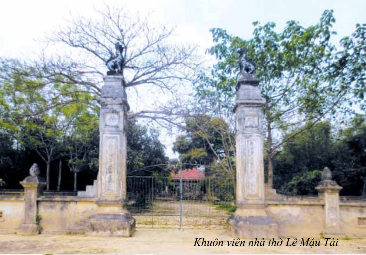
Khuôn viên nhà thờ Lê Mậu Tài