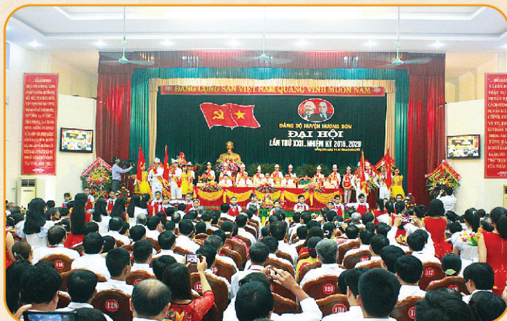
◀ Toàn cảnh đại hội