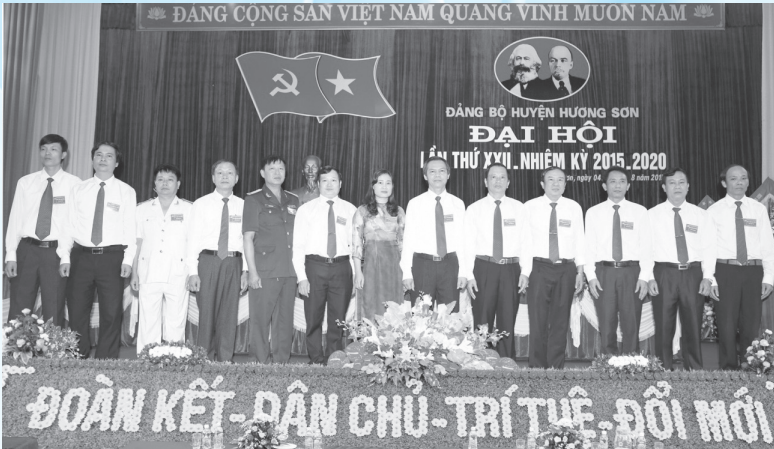
Ban Thường vụ Huyện ủy, nhiệm kỳ 2015 - 2020

Thực hiện Chỉ thị số 36-CT/TW, ngày 30/5/2014 của Bộ Chính trị về đại hội đảng bộ các cấp, tiến tới Đại hội đại biểu toàn quốc lần thứ XII của Đảng, từ ngày 4/8 đến 6/8/2015, tại Hội trường Huyện ủy đã long trọng diễn ra Đại hội đại biểu Đảng bộ huyện Hương Sơn lần thứ XXII, nhiệm kỳ 2015 - 2020.