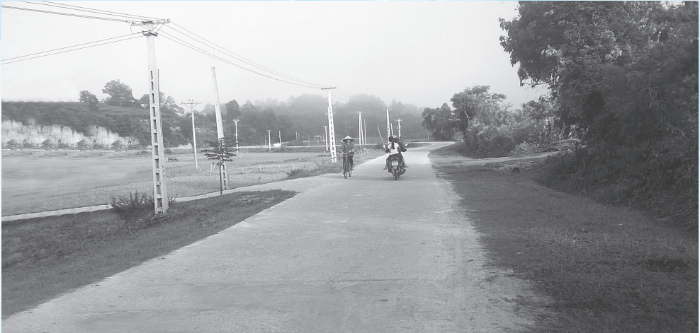
Đường về thôn Hồng Thủy

Nhờ đẩy mạnh việc huy động nội lực trong xây dựng đường giao thông nông thôn, qua 2 năm (2014 và 2015) thôn Hồng Thủy, xã Sơn Thủy đã cứng hóa được trên 3 km đường liên thôn, liên xóm. Phong trào người dân cùng chính quyền chung sức xây dựng nông thôn mới ở đây đang là một điểm sáng.