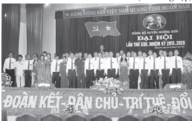
Ban Chấp hành Đảng bộ huyện, nhiệm kỳ 2015 - 2020