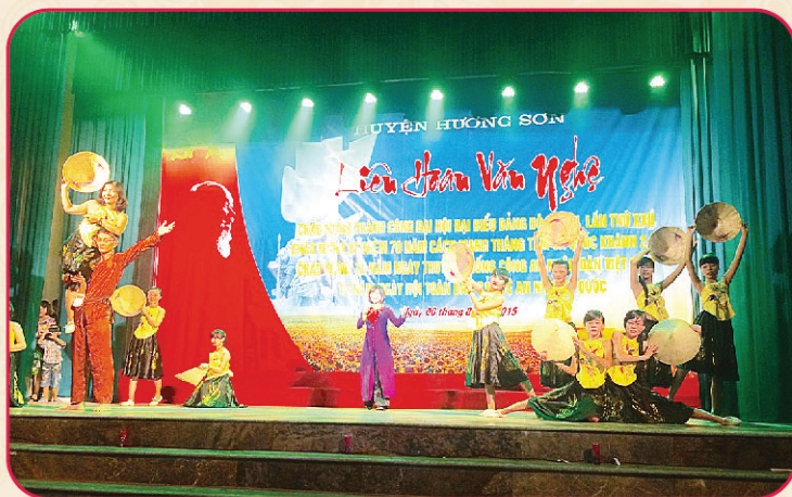
Liên hoan văn nghệ chào mừng thành công Đại hội Đảng bộ huyện và chào mừng Cách mạng tháng Tám và Quốc khánh 2/9