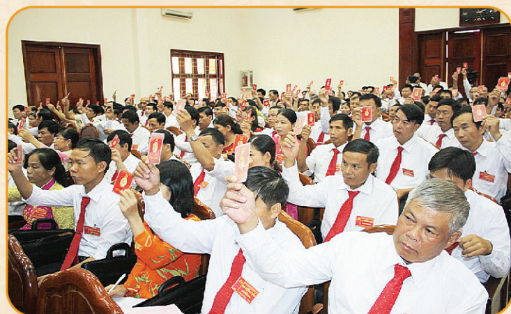
▶ Biểu quyết thông qua nghị quyết đại hội