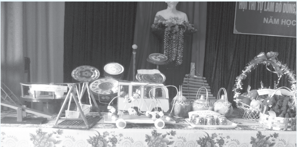
Nhiều thiết bị dạy học mới đã được các thầy cô giáo tự làm phục vụ năm học mới

Các hoạt động đổi mới công tác dạy và học được thực hiện nghiêm túc, từng bước nâng cao chất lượng giáo dục trong các nhà trường, phong trào thi đua dạy tốt, học tốt được khơi dậy ở tất cả bậc học. Chất lượng đội ngũ cán bộ, giáo viên và nhân viên ngày càng được nâng lên, có 99% giáo viên có trình độ đào tạo chuẩn và trên chuẩn. Hệ thống trường lớp được quy hoạch hợp lý, thực hiện việc quy hoạch mạng lưới trường