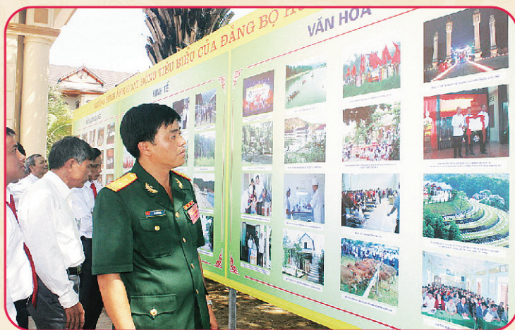
Các đại biểu tham quan bảng ảnh phản ánh kết quả trên các lĩnh vực, nhiệm kỳ 2010 - 2015