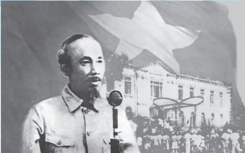
Chủ tịch Hồ Chí Minh đọc Tuyên ngôn độc lập ngày 2-9-1945

Cách mạng Tháng Tám năm 1945 thành công, ngày 2/9/1945 Chủ tịch Hồ Chí Minh thay mặt Chính phủ lâm thời, trình trọng đọc Tuyên ngôn độc lập khai sinh ra nước Việt Nam Dân chủ Cộng hòa (nay là nước Cộng hòa xã hội chủ nghĩa Việt Nam). Từ thời khắc đó đánh dấu mốc son trong lịch sử dựng nước và giữ nước của dân tộc Việt Nam, mở ra một kỷ nguyên mới, kỷ nguyên của độc lập, tự do và Chủ nghĩa xã hội. Từ một nước thuộc địa nửa phong kiến không có tên trên bản đồ thế giới đã trở thành một nước Việt Nam độc lập; Nhân dân ta từ thân phận nô lệ trở thành chủ nhân của một nước độc lập, cuộc sống tự do, hạnh phúc. Như lời Hồ Chủ tịch đã khẳng