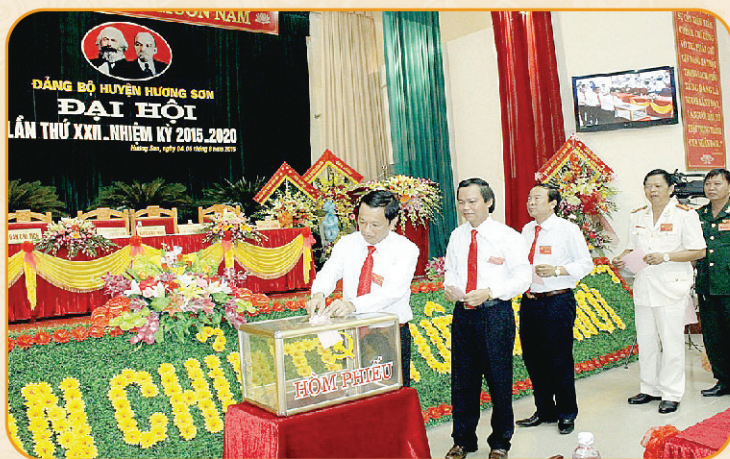
▶ Bỏ phiếu bầu Ban Chấp hành Đảng bộ huyện