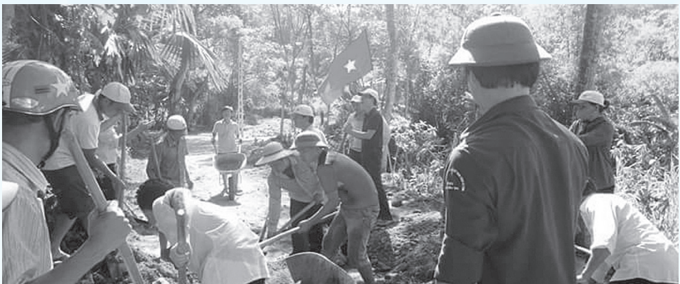
Thầy và trò trường THPT Lý Chính Thắng đồng hành cùng xã Sơn Trung trong xây dựng nông thôn mới