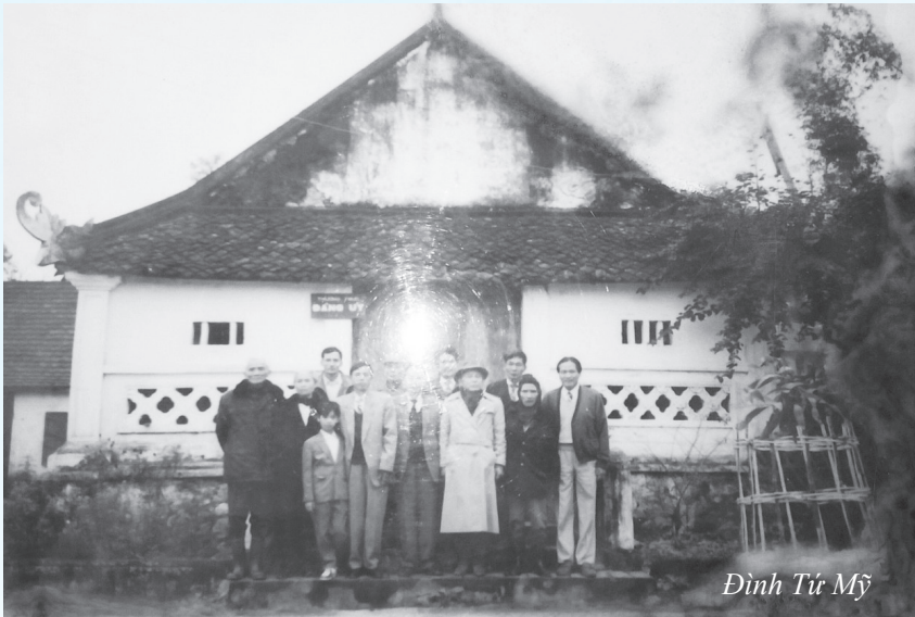
Đình Tứ Mỹ

Tự hào là cái nôi của quê hương cách mạng, trong những ngày này Đảng bộ và Nhân dân Sơn Châu đang ra sức thi đua lập nhiều thành tích chào mừng các ngày lễ lớn của đất nước; đẩy mạnh thực hiện các mục tiêu, chỉ tiêu Nghị quyết Đại hội Đảng bộ xã, Nghị quyết Đại hội Đảng bộ huyện khóa XXII.