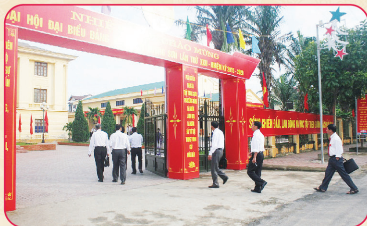
Các đại biểu về dự Đại hội