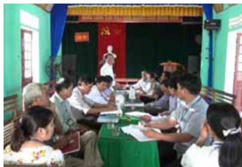
Đoàn làm việc với UBND xã Sơn Thủy

- Kiểm tra công tác xây dựng nông thôn mới: