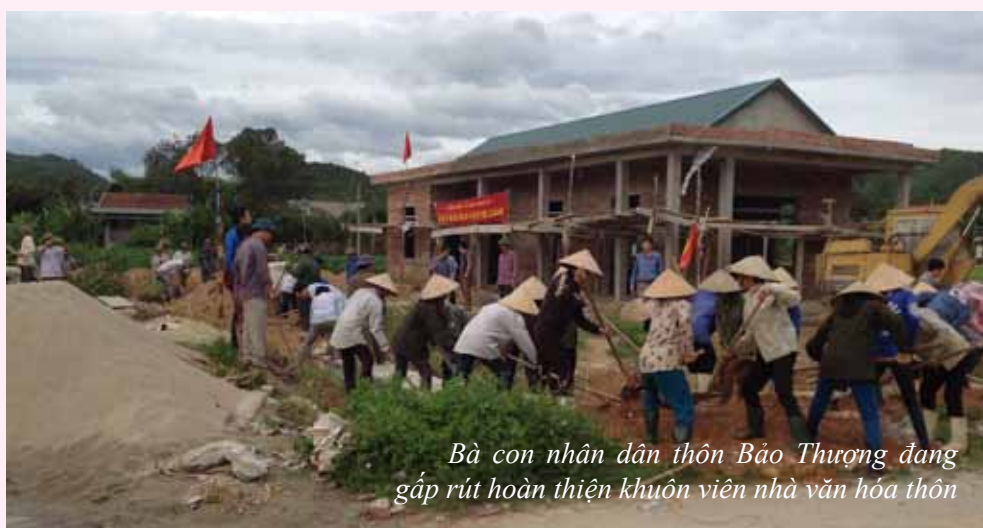
Bà con nhân dân thôn Bảo Thượng đang gấp rút hoàn thiện khuôn viên nhà văn hóa thôn

Trước nghị quyết của chi bộ, với khối lượng lớn công việc cần làm, Ban cán sự thôn họp, yêu cầu mỗi đồng chí phải có những “hiến kế” của cá nhân, hạng mục cần phải làm, ưu tiên thứ tự trước sau, cách làm như thế nào? xây dựng kế hoạch, đưa ra