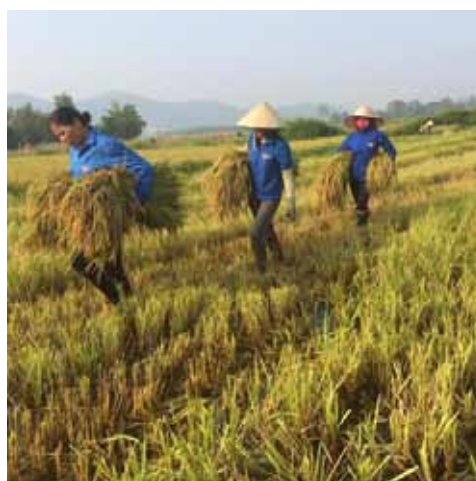
ĐVTN giúp dân thu hoạch mùa

- Đoàn thanh niên tham gia xây dựng nông thôn mới: