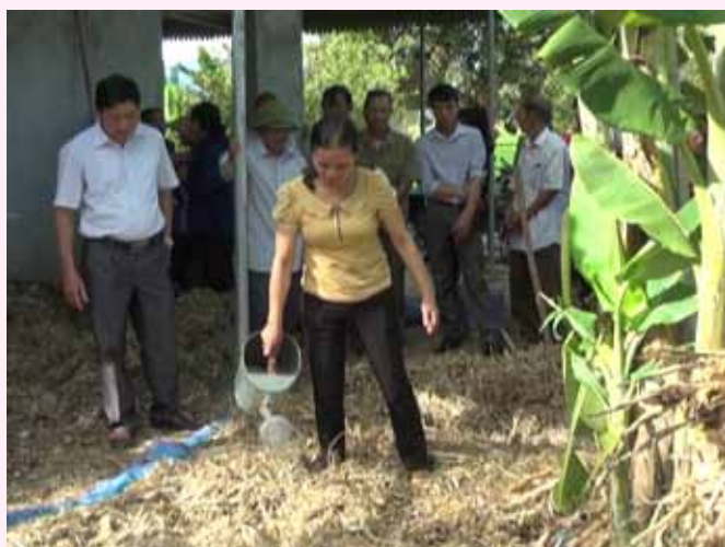
Chủ tịch Hội Nông dân xã đang hướng dẫn bà con nông dân cách ủ phân vi sinh

Hội Nông dân xã Sơn Giang có 11 chi hội với 1094 hội viên. Xác định vai trò, nhiệm vụ trọng tâm trong công tác Hội là vận động, hỗ trợ hội viên phát triển kinh tế gia đình, thoát nghèo bền vững. Thông qua các hoạt động giới thiệu hội viên tiếp cận với các nguồn vốn vay ưu đãi, tư vấn cách làm ăn, duy trì, nhân rộng các mô hình kinh tế hiệu quả, Ban Chấp hành Hội Nông dân xã đã giúp nhiều hội viên phát triển kinh tế gia đình, ổn định cuộc sống. Tính đến nay, Hội Nông dân xã tín chấp nguồn vốn Ngân hàng Chính sách xã hội, với tổng dư nợ trên 3 tỷ đồng; đứng ra tín chấp cho hội viên vay vốn với số tiền hơn 15,534 tỷ đồng từ nguồn NN & PTNT cho 300 hộ, làm tốt công tác