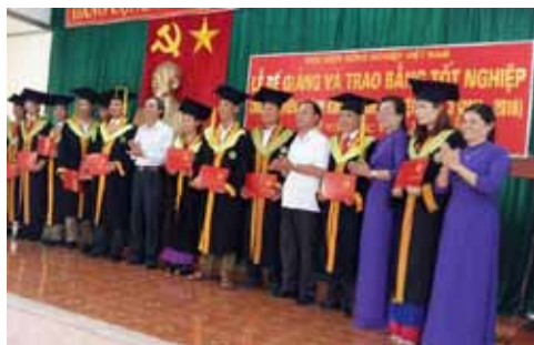
Lễ trao bằng tốt nghiệp lớp Đại học kinh tế nông nghiệp

- Bế giảng các khóa đào tạo, bồi dưỡng: Trong tháng 9, Trung tâm BDCT huyện phối hợp với các cơ sở đào tạo trong và ngoài tỉnh tổ chức lễ bế giảng và trao bằng tốt nghiệp các lớp Đại học Kinh tế Nông nghiệp khóa 3 và Trung cấp Lý luận chính trị - Hành chính khóa 109. Lớp Đại học KTNN khóa 3 có 60 sinh viên là những cán bộ chủ trì, trưởng các ngành đoàn thể và đối tượng cán bộ trong nguồn quy hoạch. Sau 5 năm học tập, dưới sự tận tình truyền thụ