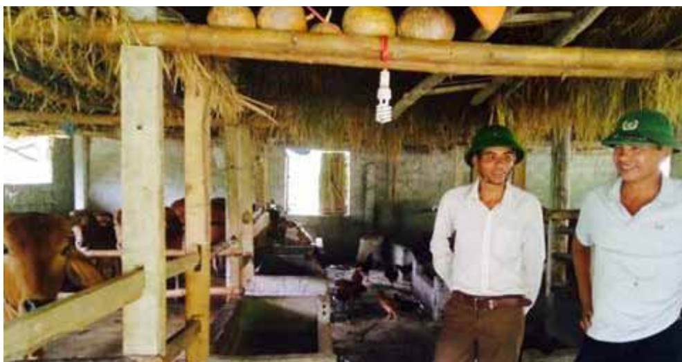
Đ/c bí thư chi bộ và thôn trưởng kiểm tra mô hình sản xuất

Khác so với một số nơi khác là hầu như khoán hẳn cho nhà thầu, thiếu kinh phí thì chia số tiền trên số nhân khẩu kêu gọi đóng góp, chứ