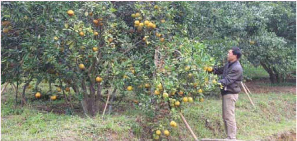
Cam - cây kinh tế chủ lực ở xã Sơn Mai

Những năm gần đây, cây cam đã đem lại hiệu quả kinh tế lớn ở xã Sơn Mai. Hàng trăm gia đình nông dân nơi đây nhờ cam mà đã thực sự trở nên khá giả, giàu có. Về Sơn Mai chưa nhằm mùa cam chín nhưng chúng tôi vẫn như bị mê hoặc trước bạt ngàn cam trĩu quả khắp làng trên xóm dưới của xã miền núi Hương Sơn này.