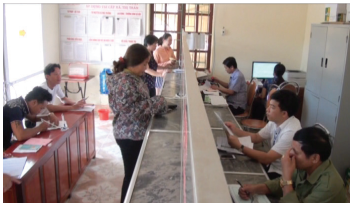
Phòng giao dịch xã Sơn Kim 1

Thực hiện nghiêm túc chủ trương của cấp trên, UBND huyện đã quán triệt đầy đủ 6 nội dung của Chương trình tổng thể cải cách hành chính: