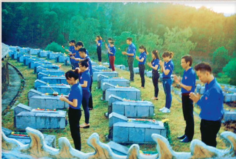
Đoàn viên thanh niên thắp nến tri ân tại Nghĩa trang liệt sỹ Năm