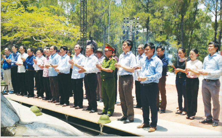
Đoàn cán bộ huyện thắp hương tại nghĩa trang Trường Sơn