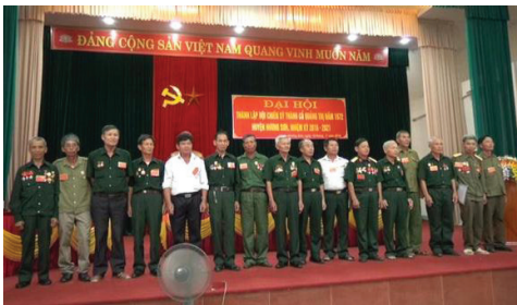
Ban chấp hành Hội chiến sỹ Quảng trị năm 1972

Vừa qua, Hội chiến sỹ Quảng Trị năm 1972 huyện tổ chức đại hội. Hội chiến sỹ bảo vệ Thành cổ Quảng Trị hiện có 122 hội viên. Hội thành lập với mục đích tập hợp đoàn kết các cán bộ, chiến sỹ đã từng chiến đấu và phục vụ chiến đấu trong chiến dịch 81 ngày đêm bảo vệ Thành cổ Quảng Trị năm 1972 đang sống và làm việc trên địa bàn huyện, nhằm khơi dậy truyền thống anh hùng trong kháng chiến chống Mỹ cứu nước nói chung và chiến dịch bảo vệ Thành cổ Quảng Trị nói riêng; đồng thời giáo dục truyền thống cách mạng cho thế hệ trẻ, góp phần tích cực thực hiện thắng lợi các nhiệm vụ của huyện. Tại Đại hội, các đại biểu đã tiến hành thảo luận và thống nhất thông qua Điều lệ, chương trình hoạt động của Hội và bầu 17 đồng chí vào BCH, nhiệm kỳ 2016 - 2021.