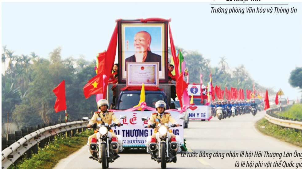
Lễ rước Bằng công nhận lễ hội Hải Thượng Lãn Ông là lễ hội phi vật thể Quốc gia

H ương Sơn là địa phương có bề dày truyền thống lịch sử, văn hóa. Cùng với quá trình hình thành và phát triển, huyện Hương Sơn đang lưu giữ một kho tàng di sản văn hóa vật thể và phi vật thể phong phú, đa dạng, là tài sản vô giá của các thế hệ cha ông truyền lại cho các thế hệ hôm nay cần được chung tay giữ gìn.