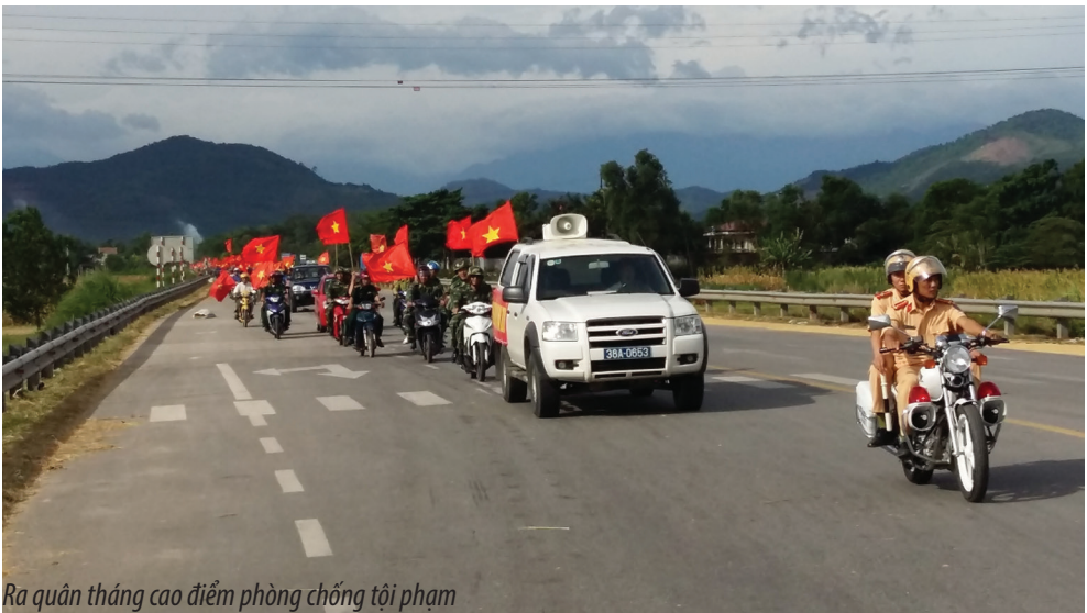
Ra quân tháng cao điểm phòng chống tội phạm

Trước thực trạng đó, Công an huyện đã chủ động tham mưu cho cấp ủy, chính quyền nhiều văn bản chỉ đạo, lãnh đạo đấu tranh phòng chống tội phạm hiệu quả. Đặc biệt triển khai