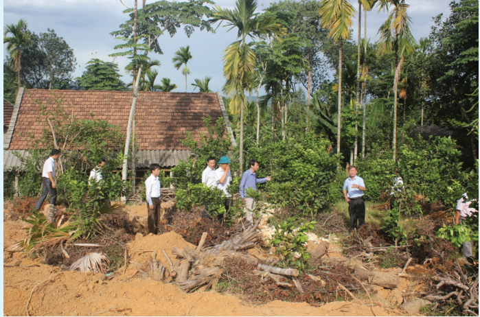
Báo cáo viên Huyện ủy nghiên cứu thực tế tại các mô hình cải tạo vườn, trồng cây ăn quả

Nâng cao hiệu quả công tác tuyên truyền miệng cho đội ngũ báo cáo viên là nhiệm vụ hết sức quan trọng trong công tác tư tưởng của Đảng, bởi đó là cầu nối giữa Đảng với dân, có ý nghĩa quyết định trong việc đưa nghị quyết của Đảng, chính sách, pháp luật Nhà nước vào cuộc sống.