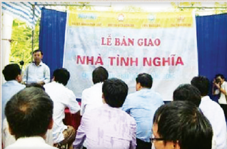
Báo Đời sống và Pháp luật phối hợp với xã Sơn Trung bàn giao nhà tình nghĩa cho các hộ dân có hoàn cảnh khó khăn