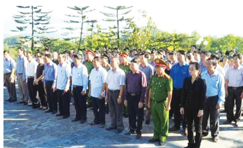
Lãnh đạo huyện và các ngành dâng hương tại Nghĩa trang liệt sỹ Năm

Nhân kỷ niệm ngày TB-LS (27/7), huyện Hương Sơn đã tổ chức nhiều hoạt động đền ơn đáp nghĩa, uống nước nhớ nguồn nhằm tri ân tới các anh hùng liệt sỹ, thương bệnh binh và thân nhân các gia đình có công với cách mạng. Đoàn lãnh đạo huyện đã tổ chức đi dâng hương, dâng hoa tưởng niệm tại Nghĩa trang Liệt sỹ Năm, Nghĩa trang Liệt sỹ Trường Sơn và Thành cổ Quảng Trị. Thành lập 15 đoàn do các đồng chí Ủy viên