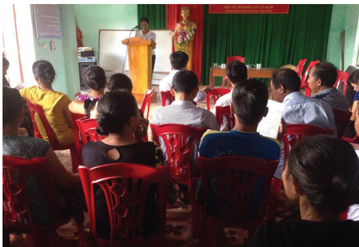
Một buổi sinh hoạt chi hội định kỳ

Không may mắn như nhiều bạn bè cùng trang lứa, chị sinh ra và lớn lên trong một gia đình có hoàn cảnh khó khăn. Năm 1990, chị lập gia đình, hai vợ chồng ra ở riêng trong căn nhà tạm bợ, cuộc sống cứ thế trôi