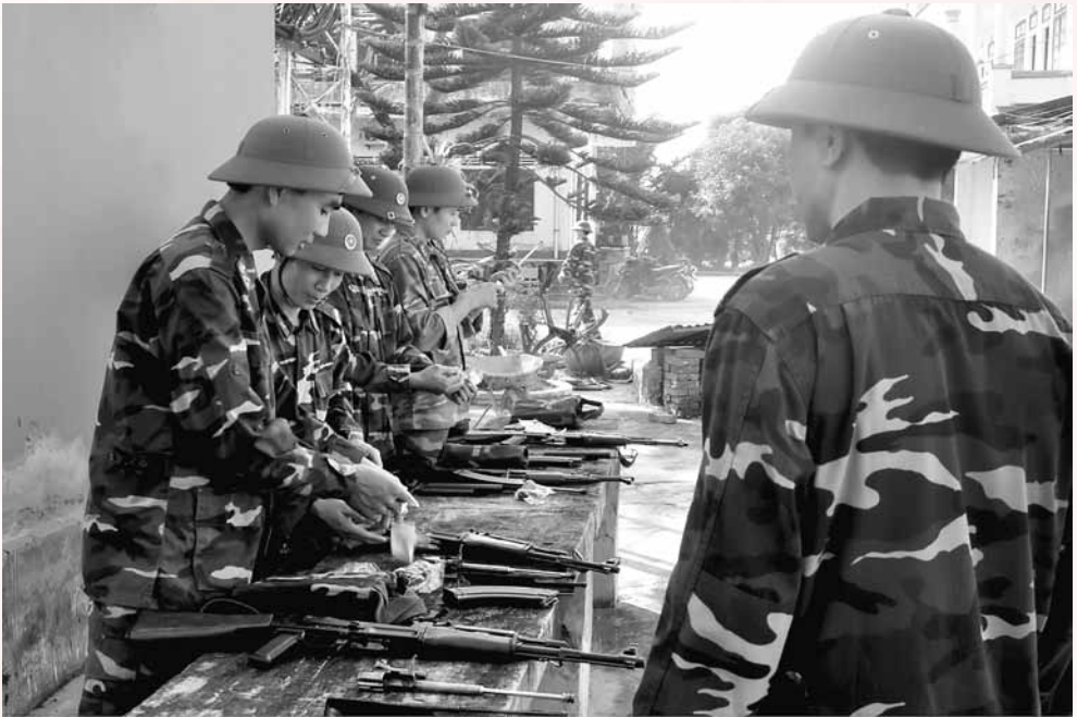
Các chiến sĩ đang kiểm tra, bảo dưỡng vũ khí