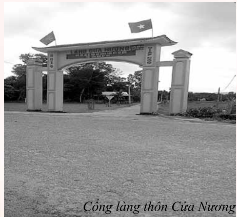
Cổng làng thôn Cửa Nương

Dẫn chúng tôi tham quan một vòng quanh thôn, ông Trần Lương Trợ - Trưởng thôn Cửa Nương tâm sự: Ngày trước, một số tuyến đường của thôn mặc dù đã huy động được nhân dân hiến cây, hiến đất và đóng góp để bê tông hóa nhưng nay xây dựng nông thôn mới mặt đường trở nên chật hẹp, không có rãnh thoát nước không đảm bảo vệ sinh môi