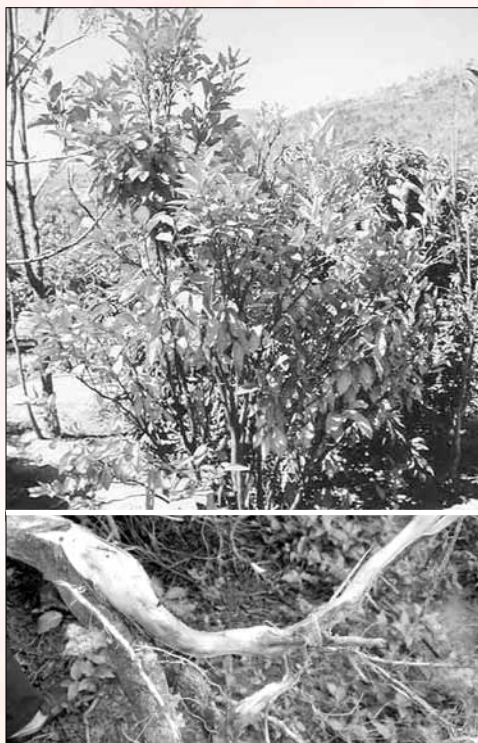
Cây cam bị vàng lá thối rễ

Bệnh vàng lá thối rễ do nấm Phytophthora tấn công bộ rễ cây, sau đó nhiều chủng nấm, vi khuẩn cùng đồng loạt tấn công, gây hại ở nhiều vị trí của bộ rễ, nấm có thể xâm nhập