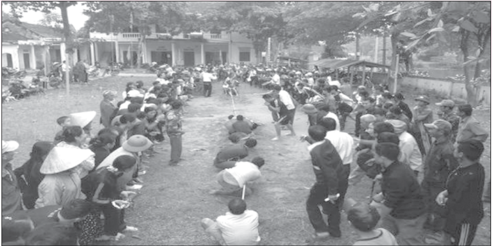
Kéo co - một hoạt động thể thao thường niên.

T rong xây dựng nông thôn mới, văn hóa giữ vai trò quan trọng, vừa là mục tiêu, vừa là động lực của sự phát triển xã hội và mục đích cuối cùng của xây dựng nông thôn mới chính là nhằm nâng cao đời sống vật chất, tinh thần của người dân. Trong 19 tiêu chí xây dựng nông thôn mới, ngoài các tiêu chí cơ bản về quy hoạch đầu tư cơ sở hạ tầng nông thôn, còn có những quy định quan trọng về phát triển văn hoá, đảm bảo môi trường, xây dựng nếp sống văn hoá nông thôn.