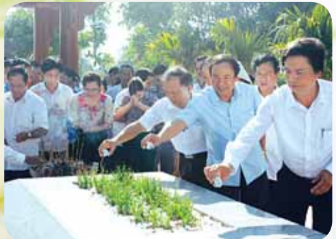
Bên mộ cụ Nguyễn Du.