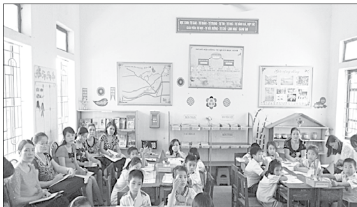
Dự giờ rút kinh nghiệm về Dạy - Học theo Mô hình trường học mới Việt Nam (VNEN) tại Trường Tiểu học Sơn Giang

Đối với cấp tiểu học triển khai chương trình Tiếng Việt lớp 1 công nghệ giáo dục (CNG), dạy học theo mô hình trường học mới Việt Nam (VNEN) gắn với việc đổi mới phương pháp dạy học và áp dụng một số phương pháp dạy học mới: Dạy học Mỹ thuật theo phương pháp Đan Mạch, phương pháp dạy học “Bàn tay nặn bột”; triển khai đánh giá học sinh Tiểu học theo nội dung và hình thức mới (Thông tư 30-TT/BGD-ĐT); cấp trung học tổ chức các cuộc thi “Sáng tạo khoa học kỹ thuật, bài thi tích hợp liên môn để giải quyết các vấn đề thực