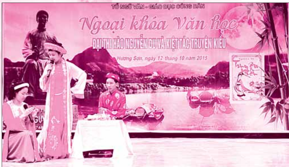
Trường THPT Lý Chính Thắng sinh hoạt ngoại khoá “Đại thi hào Nguyễn Du và kiệt tác Truyện Kiều”