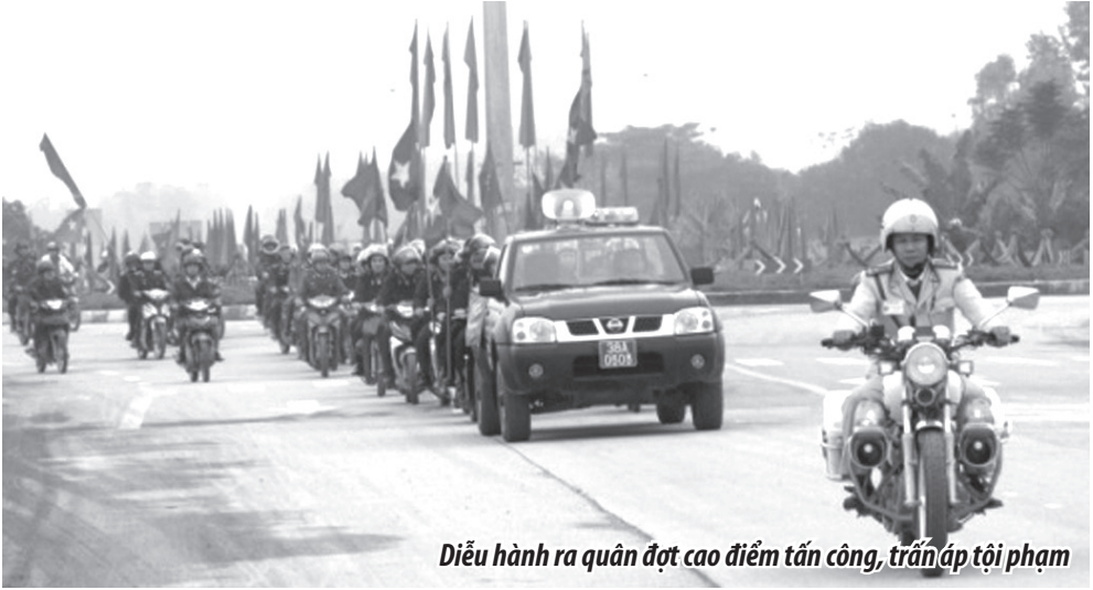
Diễu hành ra quân đợt cao điểm tấn công, trấn áp tội phạm

Năm 2015 tình hình thế giới, khu vực, trong nước có nhiều diễn biến phức tạp mới, đặt ra nhiều khó khăn, thách thức lớn đối với sự nghiệp xây dựng và bảo vệ Tổ quốc. Trên địa bàn huyện nhà tình hình an ninh biên giới, an ninh tôn giáo, hoạt động của một số loại tội phạm như giết người, trộm cắp tài sản, cố ý gây thương tích, hủy hoại tài sản... Tình hình buôn lậu, gian lận thương mại, vi phạm quy định về khai thác bảo vệ rừng, buôn bán động