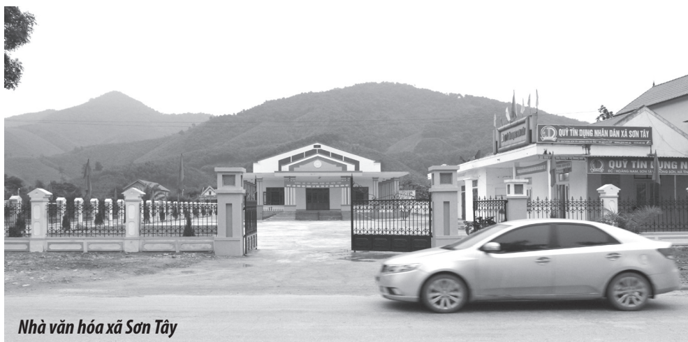
Nhà văn hóa xã Sơn Tây

Là xã nằm trong топ 26 xã về đích NTM năm 2015, Sơn Tây được đánh giá là đơn vị có cách làm sáng tạo, có sự nỗ lực vượt bậc và sự bứt phá ngoạn mục. Ít ai ngờ rằng, là xã đang rất nhiều khó khăn, mãi đến cuối năm 2014 mới được đưa vào nhóm xã phấn đấu về đích NTM năm 2015 nhưng Sơn Tây đã vượt lên, trở thành xã nằm trong топ đầu toàn tỉnh.