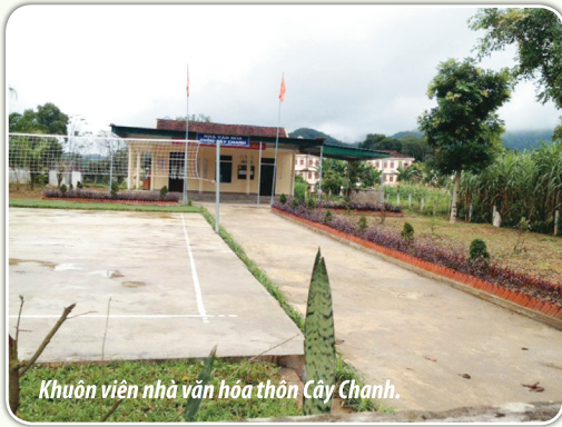
Khuôn viên nhà văn hóa thôn Cây Chanh.