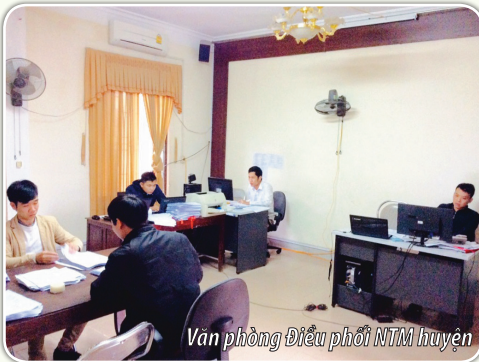
Văn phòng Điều phối NTM huyện

Đã làm tốt công tác tham mưu cho Ban chỉ đạo huyện trong lãnh đạo, chỉ đạo, điều hành đưa chương trình đi vào chiều sâu, cụ thể, gắn với vai trò trách nhiệm của từng tập thể, cá nhân; huy động cả hệ thống chính trị vào cuộc một cách đồng bộ và quyết liệt. Tham mưu cho Ban Chỉ