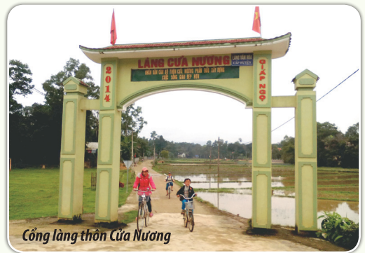
Cổng làng thôn Cửa Nương

Tổ chức, chỉ đạo hoàn thành xây dựng nhà văn hoá thôn, đường giao thông, chỉnh trang nhà ở dân cư và các hoạt động phát triển kinh tế của thôn. Năm 2015, thôn đã mở rộng mặt đường theo tiêu chí NTM trên 2 km; huy động nội lực làm mới 300 m đường bê tông; giải tỏa đường dự án, mở rộng lòng, lề đường, các đường trục trong thôn, nhân dân đã hiến trên 1500 m 2 đất vườn, đất sản xuất nông nghiệp và hàng trăm cây ăn quả, cây lấy gỗ; nhân dân đóng góp xây dựng, mua sắm, trang trí tiện nghi hội quán với số tiền trên 100 triệu đồng.