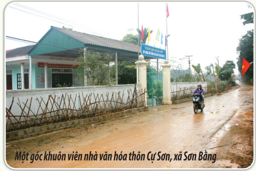
Một góc khuôn viên nhà văn hóa thôn Cự Sơn, xã Sơn Bằng

giá 112 triệu, đóng góp 914 ngày công trị giá 146,65 triệu. Sẽ phát hành lang giao thông, hành lang lưới điện được 6,925 km, làm rãnh thoát nước 2,53 km, thay thế đường dây điện sau công tơ 8,12 km, chỉnh trang 64 nhà ở, 57 vườn hộ, có 14 hộ cải tạo vườn tạp trồng cây ăn quả có hiệu quả kinh tế. Hoàn thiện 50% 10 tiêu chí khu dân cư NTM kiểu mẫu