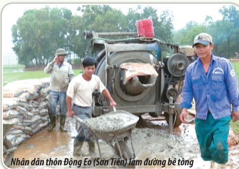
Nhân dân thôn Động Eo (Sơn Tiến) làm đường bê tông

Giải tỏa hàng lang giao thông theo tiêu chí NTM, đổ đất để nâng cấp các tuyến đường. Cứng hóa đường trục thôn với chiều dài 2.7 km, chỉnh trang khuôn viên nhà hội quán với tổng kinh phí 503 triệu đồng.