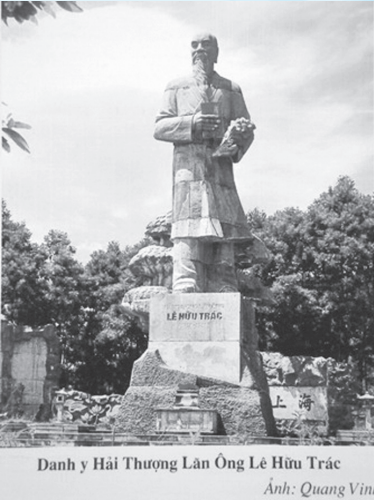
Danh y Hải Thượng Lãn Ông Lê Hữu Trác