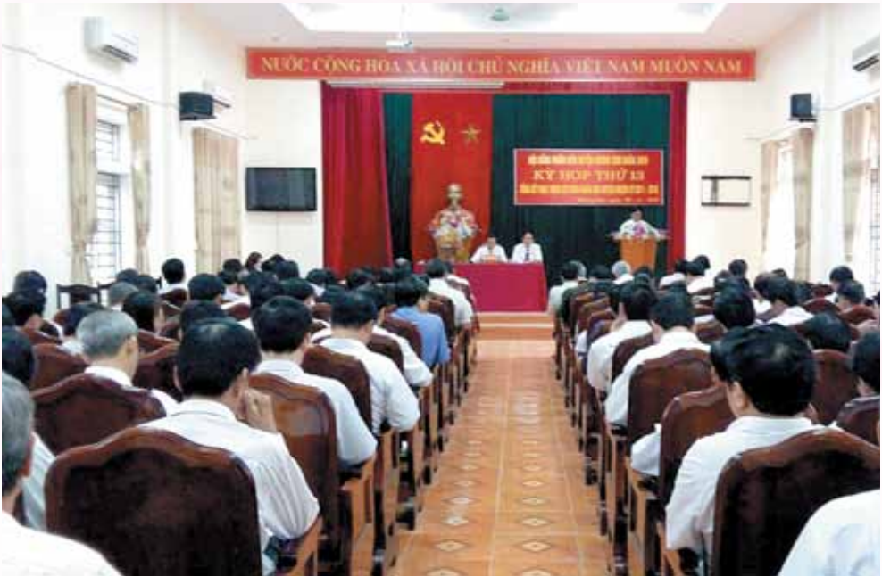
Toàn cảnh kỳ họp Hội đồng nhân dân huyện

Nhiệm kỳ 2011-2016 của HĐND huyện sắp kết thúc. Tổng kết nhiệm kỳ với những kết quả đạt được là hết sức quan trọng, đồng thời nghiêm túc nhìn nhận một số hạn chế, trên cơ sở đó rút ra bài học quý cho nhiệm kỳ tới. Dù còn những trở ngại về một số việc chưa hoàn thành, nhưng chúng ta có quyền tự hào về các kết quả đã đạt được, một lần nữa khẳng định HĐND huyện đã hoàn thành tốt chức năng, nhiệm vụ theo luật định.