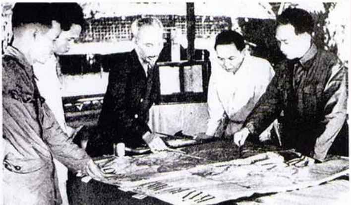
Họp bàn quyết định mở chiến dịch Điện Biên Phủ.

tập trung quân cơ động để tạo sức mạnh... Không sợ! Ta buộc chúng phải phân tán binh lực thì sức mạnh đó không còn”. Bàn tay Bác mở ra, mỗi ngón trở về một hướng. Theo tư tưởng chỉ đạo ấy, ta đã nghiên cứu kế hoạch Đông Xuân, cho những bộ phận chủ lực của ta tiến về 5 hướng chiến lược nhằm những nơi hiểm yếu và tương đối yếu của địch, chọn hướng chính là Lai