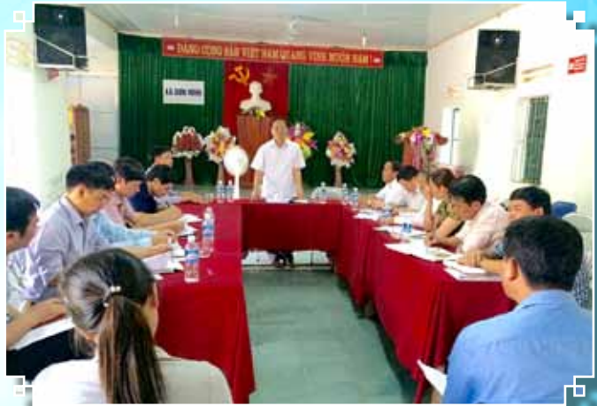
Kiểm tra tình hình thực hiện Chương trình MTQG NTM và công tác chuẩn bị bầu cử tại xã Sơn Ninh