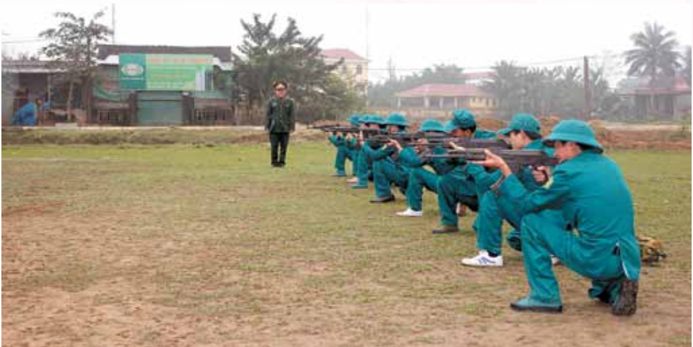
Huấn luyện dân quân tự vệ tại cụm 4

Hương Sơn là địa bàn chiến lược quan trọng trong tác chiến khu vực phòng thủ của tỉnh, Quân khu. Xác định, lực lượng dân quân tự vệ là một bộ phận trong lực lượng vũ trang của Đảng, lực lượng nòng cốt, xung kích trong lao động, sản xuất, làm dân vận và thực hiện các nhiệm vụ chính trị tại cơ sở, góp phần giữ vững an ninh chính trị và trật tự an toàn xã hội trên địa bàn. Trong những năm qua, cấp ủy, chính quyền từ huyện đến cơ sở, Ban chỉ huy Quân sự huyện (CHQS) luôn quan tâm xây dựng, nâng cao hiệu quả hoạt động của lực lượng này và đạt được những kết quả quan trọng. Đặc biệt, trong công tác huấn luyện dân quân tự vệ (DQTV) hàng năm được thực hiện nghiêm túc, bảo đảm đúng, đủ nội dung, chương trình, chất lượng ngày càng cao.