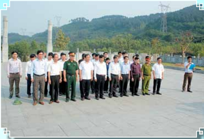
Dâng hương tại khu mộ Cố Tổng Bí thư Hà Huy Tập