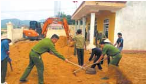
Lực lượng vũ trang huyện cùng với bà con Nhân dân xã Sơn Lâm nâng cấp nền sân nhà văn hóa thôn.

Ngày 24/4/2016: Để giúp xã Sơn Lâm hoàn thành tiêu chí về môi trường và tiêu chí cơ sở vật chất văn hóa, Công an Hương Sơn đã huy động 40 cán bộ, chiến sỹ về thôn Lâm Bình xã Sơn Lâm tham gia nạo vét, khơi thông hệ thống mương rãnh thoát nước, dọn vệ sinh môi trường, thu gom rác thải, chỉnh