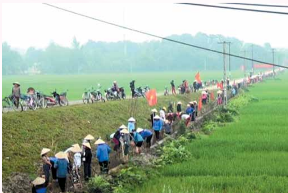
Nhân dân ra quân nạo vét kênh mương nội đồng năm 2016