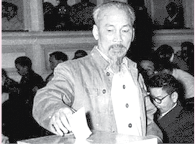
Chủ tịch Hồ Chí Minh - công dân số 1 bỏ phiếu bầu cử Quốc hội nước Việt Nam Dân chủ Cộng hòa

❖ “Tổng tuyển cử là một dịp cho toàn thể quốc dân lựa chọn những người có tài, có đức để gánh vác công việc nước nhà”... “những người trúng cử sẽ phải ra sức giữ vững nền độc lập của Tổ quốc, ra sức mưu cầu hạnh phúc của đồng bào. Phải luôn luôn nhớ và thực hành câu: vì lợi nước, quên