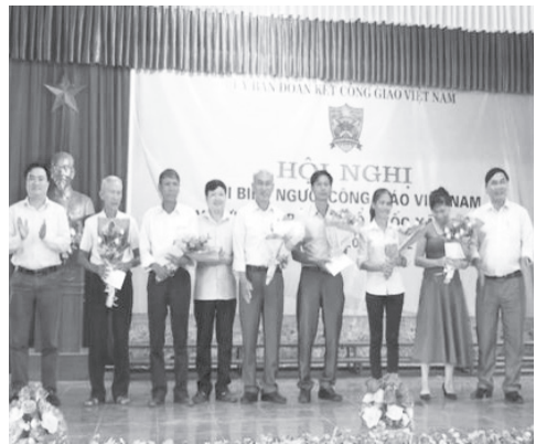
Lãnh đạo huyện và xã tặng hoa chúc mừng ban đoàn kết công giáo xã

- Sơn Kim 1 tổ chức hội nghị đại biểu người công giáo Việt Nam xây dựng và bảo vệ Tổ quốc: Ngày 19/6/2017, xã Sơn Kim 1 đã tổ chức hội nghị đại biểu người công giáo Việt Nam xây dựng và bảo vệ Tổ quốc nhiệm kỳ 2017 - 2022. Thời gian qua, các