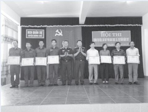
Lãnh đạo BCH Quân sự huyện trao thưởng cho cá nhân đạt giải tại hội thi

Trong 2 ngày (01 và 02/6), Ban Chỉ huy Quân sự (CHQS) huyện đã tổ chức hội thi chính trị viên, chỉ huy phó Ban CHQS xã, thị trấn năm 2017. Tham dự hội thi có các đồng chí Chính trị viên; Chỉ huy phó Ban chỉ huy quân sự của 32 xã, thị trấn. Hội thi là dịp để đánh giá chất lượng giảng dạy chính trị của đội ngũ chính trị viên; trình độ, năng lực huấn luyện quân sự của đội ngũ chỉ huy phó, ban chỉ huy quân sự xã, thị trấn. Đây cũng là dịp để các thí sinh trao đổi, học tập kinh nghiệm, nâng cao trình độ, năng lực tham mưu và triển khai thực hiện nhiệm vụ quân sự, quốc phòng ở cơ sở, góp phần xây dựng lực lượng vũ trang địa phương vững mạnh.