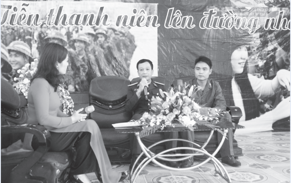
Tọa đàm gặp mặt thanh niên lên đường nhập ngũ

UVBTV Huyện ủy, Chỉ huy trưởng BCH Quân sự huyện