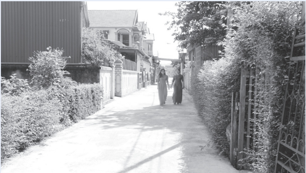
Đoạn đường nội khối xanh - sáng - đẹp

Với đặc điểm khối phố có diện tích 9,4 ha, 155 hộ dân, 858 nhân khẩu. Tổng số đảng viên tham gia sinh hoạt tại chi bộ khối phố là 29 đồng chí, trong đó có 7 đảng viên miễn sinh hoạt. Đồng hành với chi bộ là 83 đồng chí đảng viên cư trú, mọi người đã góp phần tạo nên sức