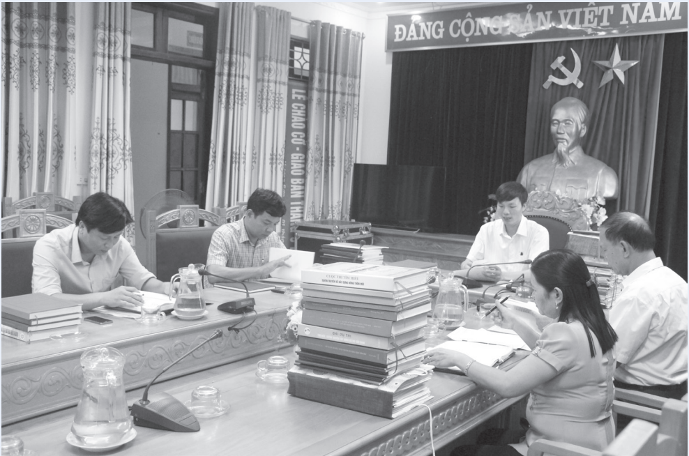
Ban Giám khảo đánh giá chất lượng bài thi

Cương trình mục tiêu quốc gia xây dựng nông thôn mới, xây dựng đô thị văn minh là chủ trương lớn của Đảng và Nhà nước, nhằm phát triển xã hội toàn diện, hài hòa, làm thay đổi diện mạo giữa nông thôn và thành thị, đời sống vật chất và