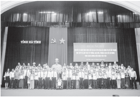
60 điển hình tiên tiến được vinh danh

TW của Bộ Chính trị về đẩy mạnh học tập và làm theo tư tưởng, đạo đức, phong cách Hồ Chí Minh. Tại Hội nghị, 60 tấm gương điển hình tiên tiến có thành tích xuất sắc trong học tập và làm theo tấm gương, đạo đức, phong cách Hồ Chí Minh trong 5 năm (2012-2017) được BTV Tỉnh ủy vinh danh là minh chứng sống động về những việc làm cụ thể, chân thực, ý nghĩa lớn lao trong học tập và làm theo lời Bác.