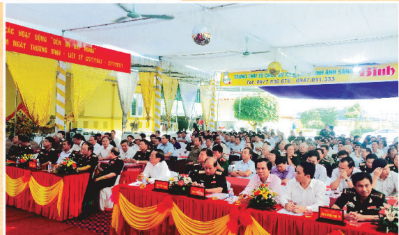
Toàn cảnh gặp mặt kỷ niệm 70 năm ngày thành lập Ban CHQS huyện