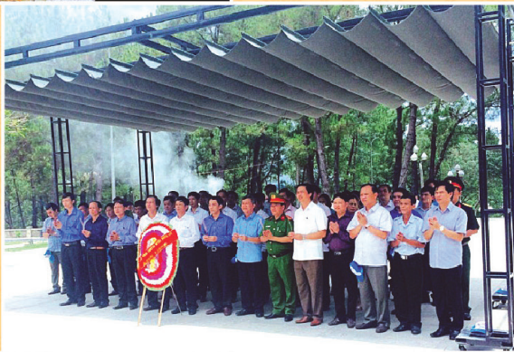
Đoàn cán bộ huyện thấp hương tại Nghĩa trang liệt sỹ Trường Sơn