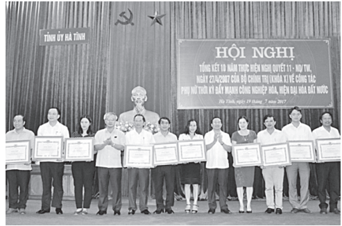
Huyện Hương Sơn được BTV Tỉnh ủy tặng bằng khen trong thực hiện Nghị quyết 11 của BCT về công tác phụ nữ

Ngày 7/7/2017, BTV Huyện ủy tổ chức tổng kết 10 năm thực hiện Nghị quyết 01-NQ/TU, ngày 13/4/2006 của Ban Thường vụ Tỉnh ủy “về tăng cường lãnh đạo công tác tái định cư, giải phóng mặt bằng đến năm 2010 và những năm tiếp theo”; tổng kết 10 năm thực hiện Nghị quyết số 11-NQ/TW, ngày 27/4/2007 của Bộ Chính trị về “Công tác phụ nữ thời kỳ đẩy mạnh công nghiệp hoá, hiện đại hoá đất nước”. Từ năm 2006 đến nay, có 68 công trình, dự án lớn nhỏ phải GPMB, ảnh hưởng trên 3.000 hộ dân với tổng diện tích đất thu hồi 283,33 ha; kinh phí bồi thường, hỗ trợ, giải phóng mặt bằng trực tiếp chi trả cho các hộ dân là 303,58 tỷ đồng. Thực hiện xây dựng 6 khu tái định cư tập trung với diện tích 4,3 ha, các lô đất tái định cư xen dăm khoảng