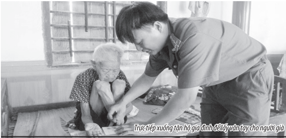
Trực tiếp xuống tận hộ gia đình để lấy vân tay cho người già

châm “Làm hết việc chứ không phải làm hết giờ”. Trung bình mỗi tuần có khoảng 600 lượt công dân đến giao dịch, làm thủ tục cấp CMND, giấy chứng nhận ngành nghề kinh doanh có điều kiện về ANTT, giấy đăng ký, sử dụng vũ khí, vật liệu nổ, công cụ hỗ trợ... tại đội Cảnh sát QLHCVTTXH. Mặc dù lượng công việc lớn nhưng cán bộ chiến sĩ trong đội thường xuyên động viên, tương trợ lẫn nhau, cố gắng hết mình thực hiện nhiệm vụ, giải quyết công việc đúng quy định, không gây phiền hà cho nhân dân”.