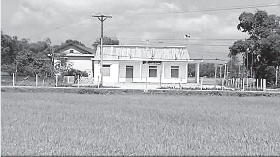
Nhà văn hóa thôn Hưng Thịnh

Về với thôn Hưng Thịnh, xã Sơn Thịnh hôm nay, hiện hữu rõ làng quê đang “thay da đổi thịt”. Các tuyến đường giờ đây đã được bê tông hóa, những ngôi nhà xây kiên cố mọc lên ngày một nhiều hơn, đời sống vật chất, tinh thần của người dân được quan tâm và ngày càng nâng cao. Người dân vui mừng, phấn khởi khi được sự quan tâm của cấp ủy Đảng, chính quyền, vận động của Ban công tác Mặt trận thôn và sự nỗ lực của nhân dân, nhà văn hóa thôn Hưng