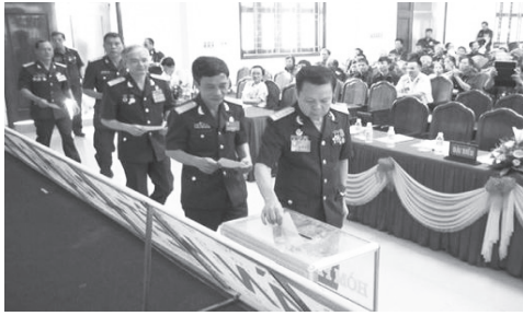
Các đại biểu bỏ phiếu bầu BCH Hội Cựu chiến binh huyện Hương Sơn nhiệm kỳ 2017 - 2022

Diễn ra trong 2 ngày 11 và 12/7. Đại hội Hội CCB huyện Hương Sơn lần thứ VI, nhiệm kỳ 2017 - 2022 đã thành công tốt đẹp. Với tinh thần đoàn kết, dân chủ, đổi mới, Đại hội Hội CCB huyện đã đánh giá kế quả thực hiện các mục tiêu, nhiệm vụ nhiệm kỳ 2012 - 2017; đồng thời tập trung thảo luận, quyết nghị các mục tiêu, giải pháp nhiệm kỳ 2017 - 2022. Đại hội đã bầu 19 đồng chí vào BCH Hội CCB khóa VI và bầu Đoàn đại biểu đi dự Đại hội cấp trên.