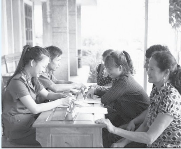
Hướng dẫn nhân dân kê khai thông tin vào các biểu mẫu cấp chứng minh nhân dân

Hưởng ứng cuộc vận động “Xây dựng phong cách người Công an nhân dân bản lĩnh, nhân văn, vì nhân dân phục vụ”. Trong thời gian qua cán bộ, chiến sĩ đội Cảnh sát quản lý hành chính về trật tự xã hội (QLHCVTXXH) Công an huyện không ngừng nâng cao bản lĩnh chính trị, trình độ chuyên môn, nghiệp vụ, phẩm chất đạo đức, lối sống, đẩy mạnh cải cách hành chính vì Nhân dân phục vụ.