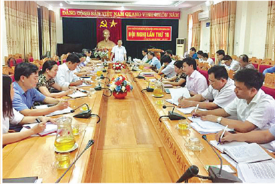
Hội Nghị BCH Đảng bộ huyện lần thứ 16