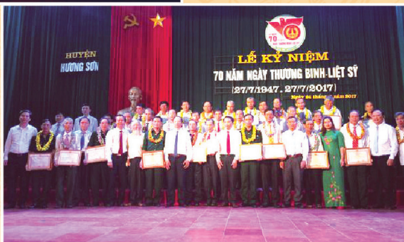
Vinh danh các thương, bệnh binh nhân kỷ niệm 70 năm Ngày TB-LS