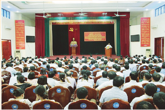
Hội nghị triển khai chuyên đề năm 2017 học tập và làm theo tư tưởng, đạo đức, phong cách Hồ Chí Minh