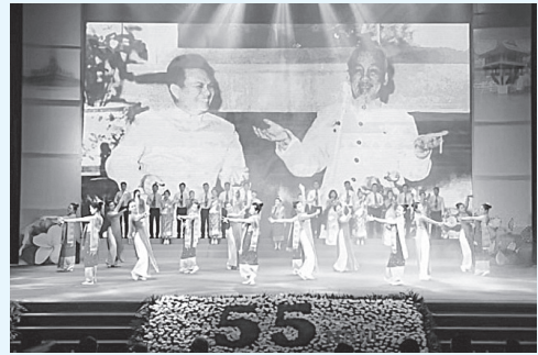
Lễ kỷ niệm 55 năm Ngày thiết lập quan hệ ngoại giao Việt - Lào

Ngày 18/7/2017, tại Hà Nội, BCH Trung ương, Quốc hội, Chủ tịch nước, Chính phủ, Ủy ban Trung ương Mặt trận Tổ quốc Việt Nam và TP. Hà Nội đã tổ chức trọng