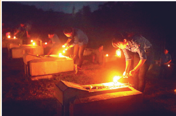
Thắp nến tri ân tại Nghĩa trang liệt sỹ Năm