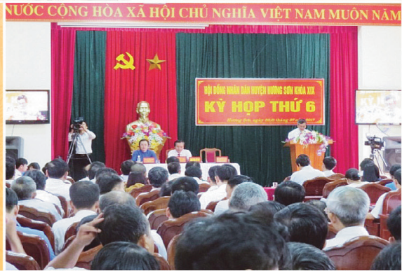
Kỷ họp thứ 6 - HĐND huyện Hương Sơn khóa XIX