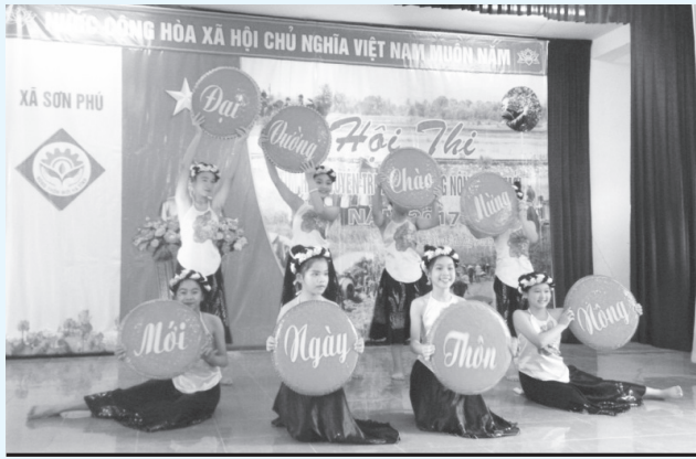
Màn thi chào hội của đội Đại Vương, xã Sơn Phú

Vào những ngày tháng 7 này, đi đến địa phương nào cũng bắt gặp hình ảnh người dân trao đổi, bàn bạc về Hội thi, tập luyện, háo hức bước vào Hội thi “Tìm hiểu và tuyên truyền nông thôn mới, đô thị văn minh”.