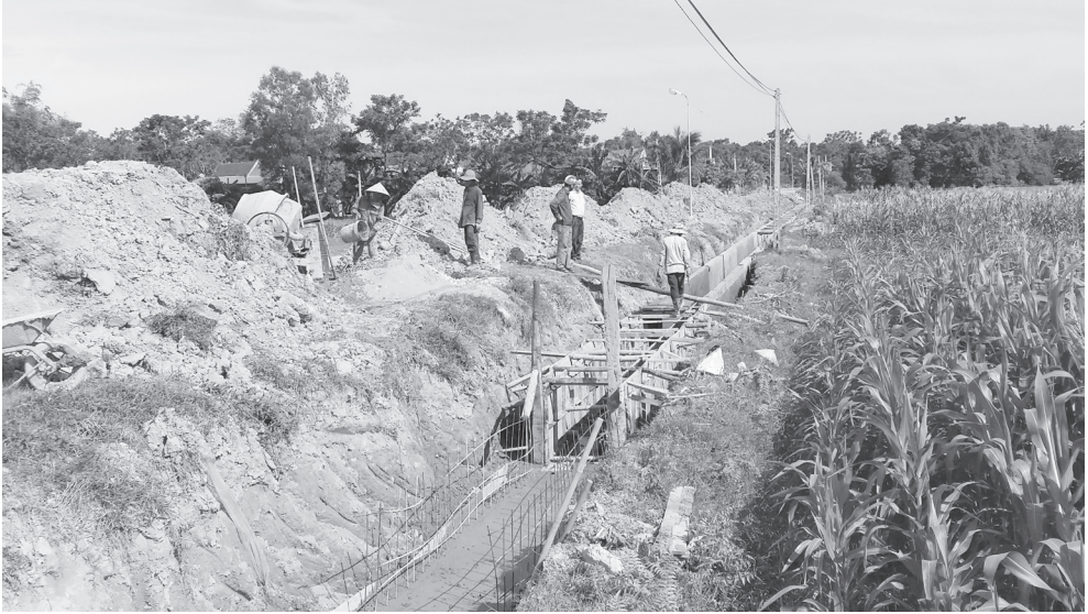
Kênh mương nội đồng đang được khép kín ở xã Sơn Hà

Về Sơn Hà những ngày này, dễ dàng bắt gặp không khí thi đua trong phong trào thực hiện chương trình mục tiêu quốc gia xây dựng nông thôn mới (NTM). Xuất phát từ một xã thuần nông, điều kiện phát triển kinh tế khó khăn, phần lớn hộ dân độc canh cây lúa, cây màu. Để nâng cao chất lượng cuộc sống của người dân, những năm qua, xã đã có nhiều giải pháp chuyển đổi cơ cấu giống,