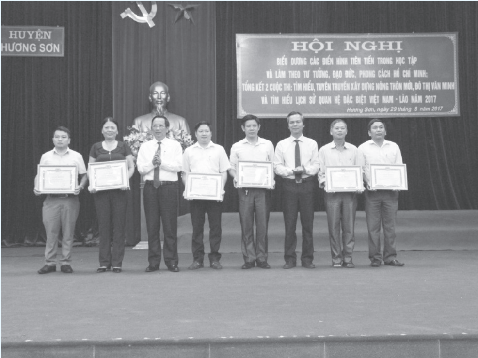
Trao thưởng các tập thể có thành tích trong hưởng ứng cuộc thi tìm hiểu lịch sử quan hệ đặc biệt Việt Nam – Lào năm 2017

cuộc thi và khen thưởng cho tập thể trong công tác tổ chức, trao giải cá nhân có bài thi chất lượng tốt. Trong thời gian tổ chức cuộc thi tìm hiểu lịch sử quan hệ đặc biệt Việt Nam - Lào, Lào - Việt Nam, trong lúc cuộc thi sân khấu hóa về tìm hiểu, tuyên truyền chủ trương, chính sách