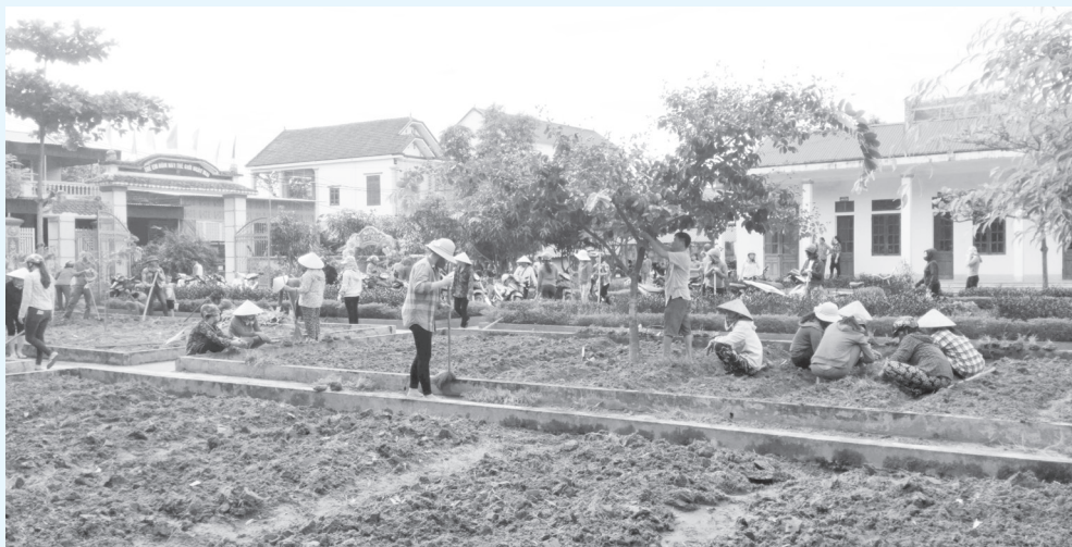
Giáo viên và phụ huynh trường Mầm non Sơn Tây lao động chuẩn bị cho năm học mới

K ết thúc năm học 2016 - 2017, ngành Giáo dục Hương Sơn đã giành được những kết quả thắng lợi toàn diện trên các lĩnh vực, phát huy thành quả đã đạt được, toàn ngành đang ra sức thi đua chuẩn bị các điều kiện bước vào năm học mới 2017 - 2018.