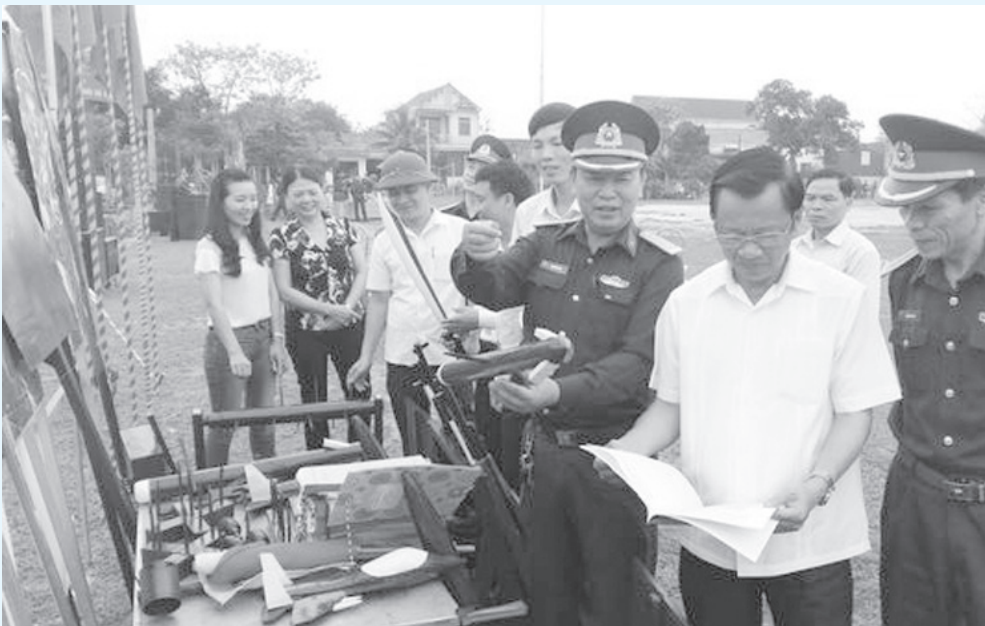
Bí thư Huyện ủy cùng các đồng chí trong đoàn kiểm tra mô hình học cụ trong buổi lễ ra quân huấn luyện

Thấm nhuần lời dạy của Bác “thi đua là yêu nước, yêu nước thì phải thi đua và những người thi đua là những người yêu nước nhất”. Thực hiện phong trào thi đua quyết thắng 5 năm qua dưới sự lãnh đạo của Đảng, chỉ đạo của Đảng ủy quân sự tỉnh và sự lãnh đạo, chỉ đạo trực tiếp của cấp ủy, chính quyền, sự phối kết hợp thường xuyên có hiệu quả của các ban, ngành, đoàn thể cấp huyện, sự đoàn kết khắc phục khó khăn, quyết tâm hoàn thành xuất sắc nhiệm vụ của LLVT huyện nhà.