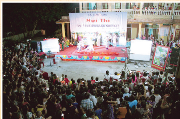
Hội thi tìm hiểu và tuyên truyền xây dựng NTM tại xã Sơn Hòa