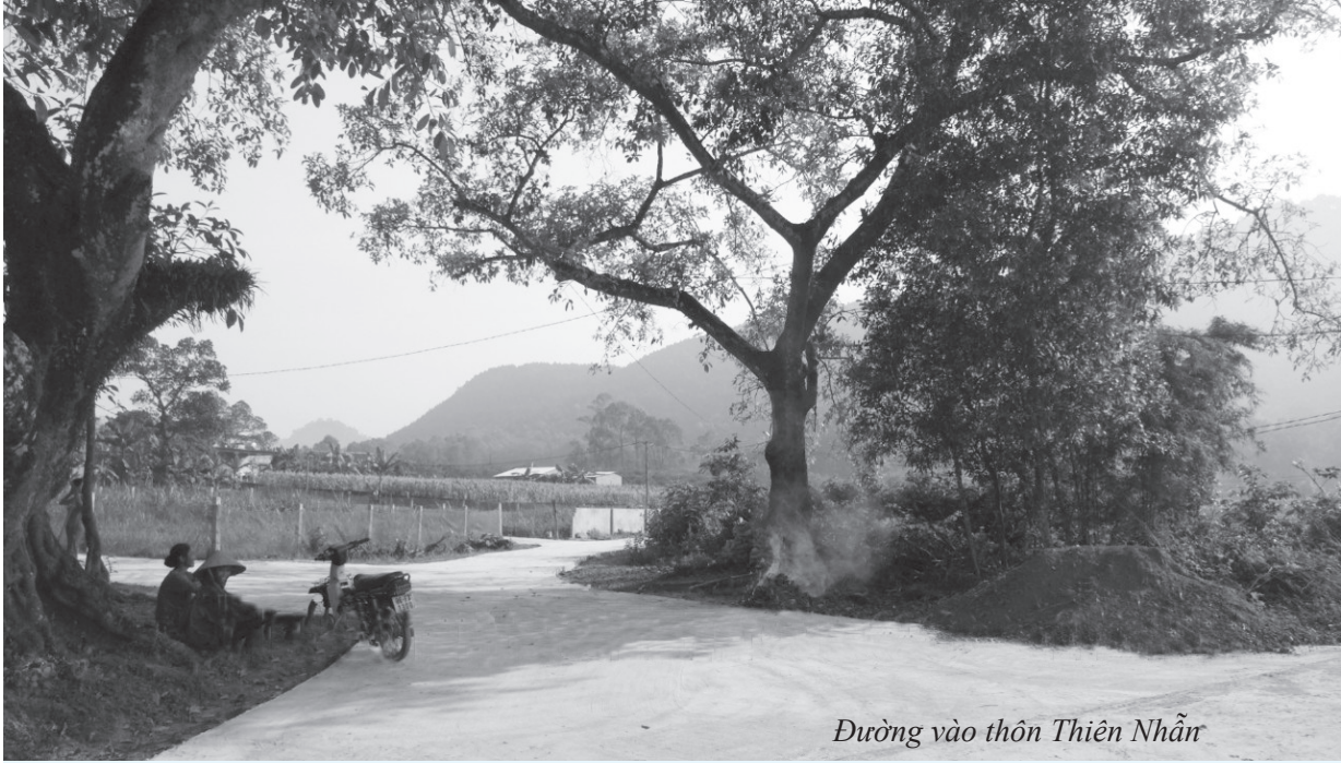
Đường vào thôn Thiên Nhẫn

vai trò, nhiệm vụ truyền tải nội dung của nghị quyết đến 100% hội viên, đoàn viên. Phân công đảng viên, ban mặt trận chịu trách nhiệm từng hộ gia đình có địa chỉ cụ thể, phân công mỗi tổ chức đoàn thể đảm nhận một khối lượng công việc cụ thể để chịu trách nhiệm thực hiện kế hoạch, lộ trình nghị quyết đề ra như: Vận động các hộ cải tạo vườn định hướng quy hoạch và trồng mới các cây có hiệu quả, đảm nhận các cung đường do tổ chức mình quản lý, phân công hàng tuần luân phiên ra quân dọn vệ sinh ngày chủ nhật xanh, vận động tiền, ngày công làm đường, đường điện thấp sáng đường quê.... Trong quá trình tổ chức thực hiện công tác kiểm tra, giám sát đánh giá rút kinh nghiệm là hết sức quan trọng. Trước các kỳ sinh hoạt định kỳ của chi bộ, cấp ủy chịu trách nhiệm đánh