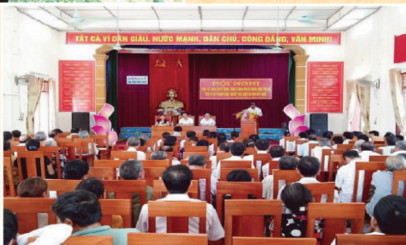
Hội nghị Tổng kết điểm Nghị quyết TW3 (khóa VII) về chiến lược cán bộ thời kỳ đẩy mạnh CNH-HĐH đất nước tại Thị trấn Phố Châu