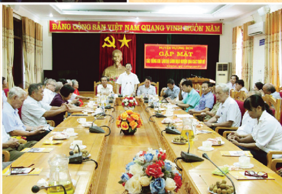
Gặp mặt các đồng chí lãnh đạo huyện qua các thời kỳ, nhân kỷ niệm 72 năm Ngày Quốc khánh (2/9)