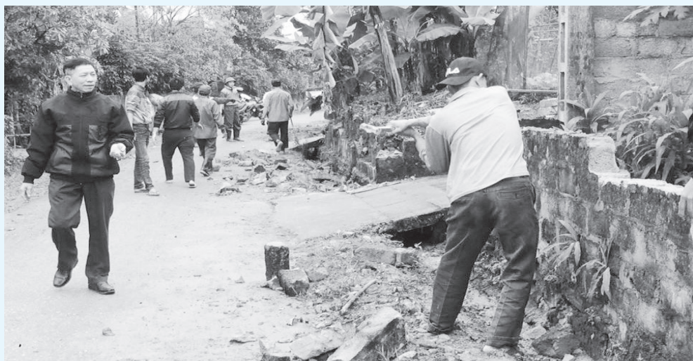
Nhân dân hiến đất, bờ rào mở rộng nền đường tại xã Sơn Tây

Hưởng ứng chiến dịch 10 ngày toàn dân ra quân làm giao thông thủy lợi, nhiều địa phương trên địa bàn huyện đồng loạt tổ chức lễ phát động ra quân làm giao thông, rãnh thoát nước, thủy lợi nội đồng, góp phần đẩy nhanh phát triển sản xuất, nâng cao đời sống nhân dân và làm thay đổi diện mạo các vùng quê.