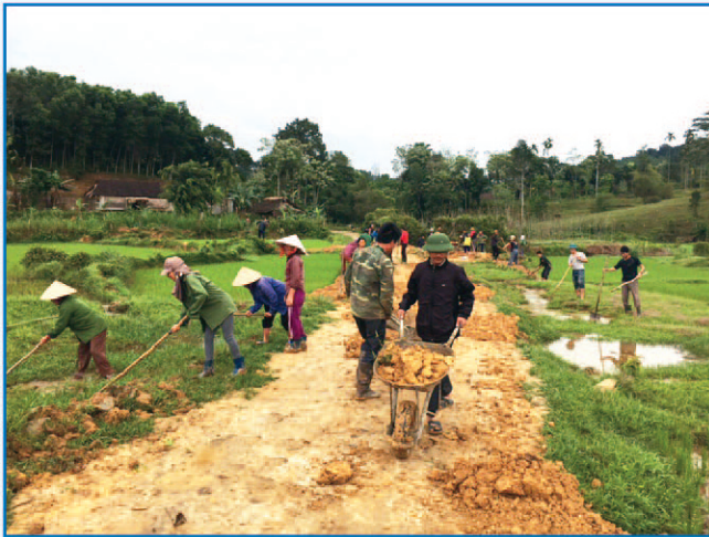
Nhân dân thôn 10 (Sơn Hồng) tham gia chiến dịch GTNT