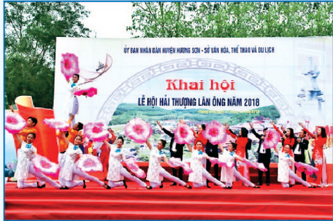
Khai hội lễ Hội Hải Thượng Lãn Ông huyện Hương Sơn năm 2018