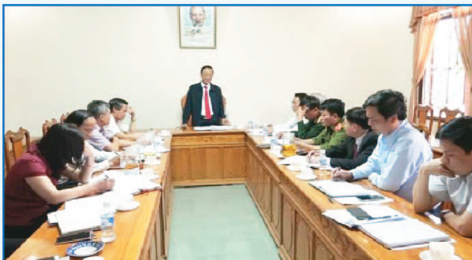
Ban Thường vụ Huyện ủy họp soát xét thực hiện Kết luận 05 về nhiệm vụ xúc tiến đầu tư