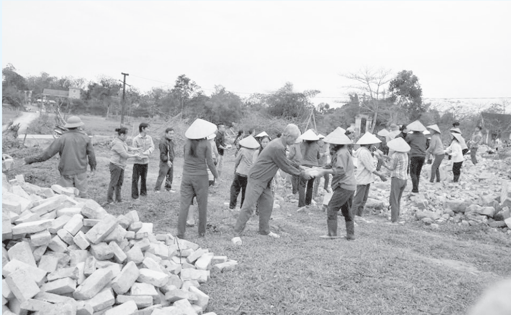
Nhân dân thôn Tiến Thịnh chuẩn bị vật liệu làm khuôn viên nhà văn hóa thôn

Với sự nỗ lực của cấp ủy, chính quyền và nhân dân, đến nay xã Sơn Thịnh đã hoàn thành 14/20 tiêu chí nông thôn mới. Các tiêu chí còn lại đang được cả hệ thống chính trị và nhân dân tập trung cao độ, quyết tâm để “cán đích” nông thôn mới (NTM) trong năm 2018.