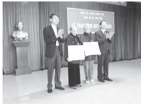
Trao tặng huy hiệu 70 năm tuổi Đảng cho các đảng viên tại xã Sơn Bình

Nhân dịp kỷ niệm 88 năm ngày thành lập ĐCS Việt Nam, huyện Hương Sơn đã tổ chức trao tặng, truy tặng huy hiệu Đảng cho 180 đảng viên. Trong đó 17 đồng chí nhận huy hiệu 30 năm tuổi Đảng; 26 đồng chí nhận huy hiệu 40 năm tuổi Đảng; 32 đồng chí nhận huy hiệu 45 tuổi Đảng; 60 đồng chí nhận huy hiệu 50 năm tuổi Đảng; 16 đồng chí nhận huy hiệu