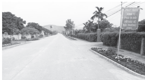
Đường vào Khu dân cư mẫu thôn Chế Biển

Từ ngày 21-27/3/2018, Ban Giám khảo cuộc thi Khu dân cư nông thôn mới kiểu mẫu Hà Tĩnh đã tổ chức chấm thi thực tế tại các thôn và lựa chọn 15 khu dân cư NTM vào vòng chung kết lần 1. Trong đó, thôn Chế Biển, xã Sơn Kim 2, lọt vào vòng chung kết lần 1 cuộc thi “Khu dân cư nông thôn mới kiểu mẫu, vườn mẫu Hà Tĩnh”. Cuộc thi chung kết lần 1 dự kiến tổ chức vào ngày 8/4/2018 để lựa chọn ra 9 khu dân cư NTM kiểu mẫu điển hình vào vòng chung kết lần 2 tổ chức vào ngày 14/4/2018 và được truyền hình trực tiếp trên Đài Phát thanh và Truyền hình tỉnh Hà Tĩnh.