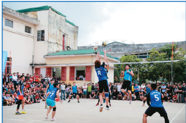
Giải bóng chuyền nam, nhân kỷ niệm 87 năm ngày thành lập Đoàn, 72 năm ngày Thể thao Việt Nam