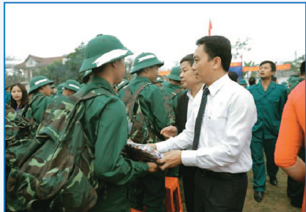
Tặng quà cho tân binh trước khi lên đường nhập ngũ