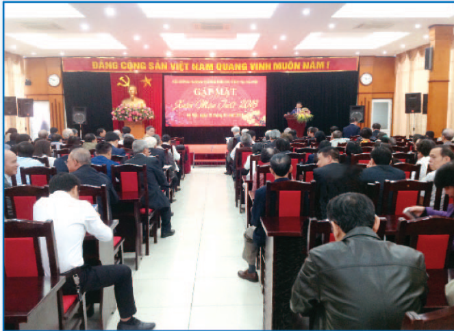
Lãnh đạo huyện gặp mặt con em Hương Sơn tại Hà Nội nhân dịp xuân Mậu Tuất - 2018