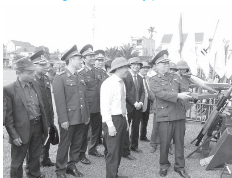
Tham quan mô hình học cụ

Thực hiện kế hoạch, huyện Hương Sơn vừa tổ chức lễ ra quân huấn luyện và phát động phong trào thi đua LLVT Hương Sơn thi đua huấn luyện giỏi, SSCĐ cao, chấp hành nghiêm pháp luật, kỷ luật và đảm bảo an toàn. Theo kế hoạch các lực lượng cán bộ chỉ huy cơ quan quân sự, dân quân tự vệ, dự bị động viên được học tập chính trị, giới thiệu về tính năng của một số vũ khí thông dụng. Huấn luyện lực lượng sử dụng thành thạo các loại vũ khí, trang bị có trong biên chế và vũ khí trang bị mới, cơ động lực lượng, phương tiện linh hoạt; SSCĐ trong mọi tình huống, cũng như ứng phó các sự cố, thảm họa, thiên tai có thể xảy ra... Sau huấn luyện sẽ tổ chức hội thi, hội thao đánh giá chất lượng huấn luyện. Thời gian huấn luyện bắt đầu từ ngày 01/3 đến ngày 30/12/2018. Tại lễ ra quân huấn luyện, Ban CHQS huyện đã phát động phong trào thi đua trong toàn lực lượng và tổ chức ký cam kết thi đua giữa các đơn vị.