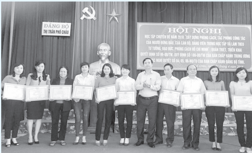
TT Phó Châu trao thưởng cá nhân đạt giải trong “Cuộc thi tìm hiểu Cương lĩnh, Điều lệ và các Quy định của Đảng”

Nằm trong chuỗi hoạt động thiết thực chào mừng kỷ niệm 88 năm Ngày thành lập Đảng Cộng sản Việt Nam (3/2/1930 - 3/2/2018), Huyện ủy Hương Sơn đã ban hành Kế hoạch số 33-KH/HU, ngày 14/7/2017 phát động đợt nghiên cứu, học tập và tổ chức Cuộc thi tìm hiểu “Cương lĩnh, Điều lệ và các Quy định của Đảng”. Kế hoạch đã thu hút được đông đảo cán bộ, đảng viên tham gia và tạo nên sức lan toả mạnh mẽ trong phong trào học tập, quán triệt các chủ trương, nghị quyết của Đảng các cấp.