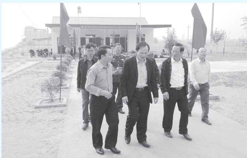
Kiểm tra hội quán đạt chuẩn nông thôn mới tại xã Sơn Trung

S inh thời Chủ tịch Hồ Chí Minh đã rất quan tâm đến thực hiện Quy chế dân chủ cơ sở, theo Hồ Chí Minh: Thực hành dân chủ là cái chìa khóa vạn năng có thể giải quyết mọi khó khăn. Từ kết quả thực hiện nhiệm vụ chính trị và công tác xây dựng Đảng trên toàn địa bàn huyện thời gian qua càng chứng minh rõ quan điểm trên.