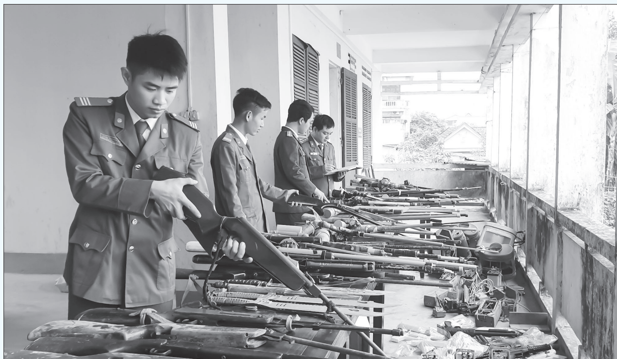
Công an Hương Sơn phối hợp Công an các xã, thị trấn thu hồi trên 200 vũ khí, vật liệu nổ, công cụ hỗ trợ

Thực hiện kế hoạch ra quân đợt cao điểm tấn công, trấn áp tội phạm, đảm bảo