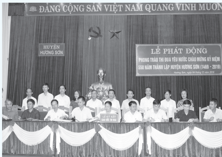
Lãnh đạo huyện chứng kiến các đơn vị ký giao ước thi đua