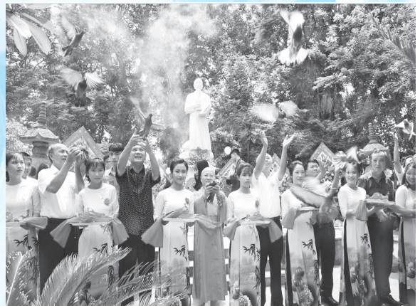
Lễ khánh thành tượng Lê Hữu Trác ở khuôn viên chùa Tượng Sơn

Dân Việt Nam tự hào Lê Hữu Trác Công đức của người biển rộng trời cao Theo tấm gương tự hào, truyền thống Giữa bầu trời lấp lánh một vì sao