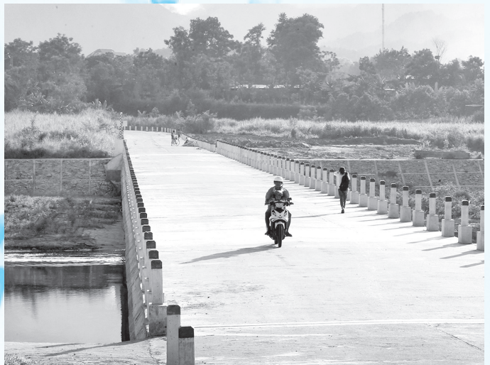
Cầu nối ốc đảo Trại Lưu - Sơn Tây

(***) Bến phà Hà Tân tọa độ bom mỹ đánh để chia cắt trục đường giao thông số 8.