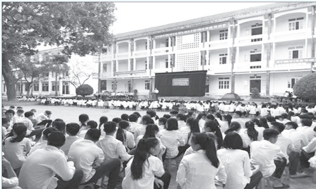
Trên 1.000 cán bộ giáo viên và học sinh trường THPT Lê Hữu Trác tham gia chương trình ngoại khóa giáo dục chủ nghĩa yêu nước và đạo đức cách mạng

T rong những năm qua, công tác giáo dục lý luận chính trị, giáo dục truyền thống trên địa bàn huyện có vai trò quan trọng, góp phần vào việc giác ngộ cách mạng, nâng cao nhận thức chính trị, thống nhất ý chí, hành động của cán bộ, đảng viên và Nhân dân nhằm thực hiện thắng lợi các mục tiêu, nhiệm vụ đề ra, xây dựng huyện nhà ngày càng phát triển.