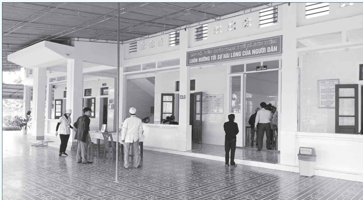
Trạm y tế Sơn Diệm - Mô hình điểm trạm y tế giai đoạn 2018-2020

Hoạt động khám, chữa bệnh đã có nhiều chuyển biến tích cực theo hướng nâng cao