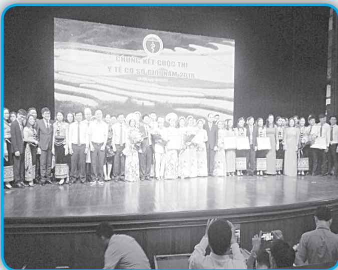
Hương Sơn Hà Tĩnh đạt giải nhất toàn quốc cuộc thi y tế cơ sở giỏi năm 2018

- Văn hóa, thể thao đạt kết quả nổi bật; tham gia Liên hoan Dân ca Ví, Giặm cấp liên tỉnh Hà Tĩnh - Nghệ An đạt giải Nhì toàn đoàn. Giải chạy Việt dã toàn tỉnh xếp nhất toàn đoàn; Giải đua thuyền toàn tỉnh đạt giải Nhất nữ và giải Nhì nam, bóng chuyền đạt giải ba.