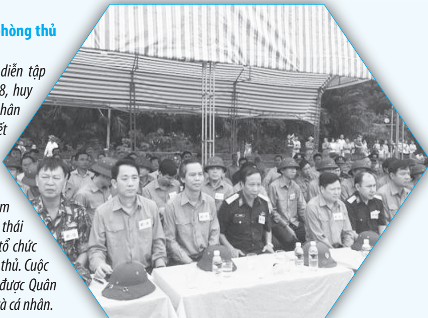
Đại biểu tham dự lễ diễn tập đánh địch đổ bộ đường không tại xã Sơn Tây

Hương Sơn tổ chức thành công diễn tập chiến đấu phòng thủ huyện năm 2018, huy động trên 1000 cán bộ, chiến sỹ và nhân dân, cùng hàng trăm phương tiện, thiết bị... Cuộc diễn tập đã hoàn thành 3 giai đoạn, thể hiện quán triệt sâu sắc, vận dụng có hiệu quả các văn bản của Đảng, Nhà nước trong thực hiện nhiệm vụ điều hành địa phương ở các trạng thái quốc phòng, chuyển sang thời chiến, tổ chức chuẩn bị và thực hành tác chiến phòng thủ. Cuộc diễn tập đảm bảo an toàn tuyệt đối, được Quân khu, Tỉnh tặng Bằng khen cho tập thể và cá nhân.