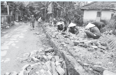
Hộ dân hiến đất, bờ tường kiên cố để mở rộng nền đường

Bên cạnh đó, xác định công tác xã hội hóa, huy động các nguồn lực từ nội tại nhân dân địa phương nói riêng, con em Sơn Bình trên mọi miền Tổ quốc nói chung, cũng như các nguồn lực xã hội hóa khác để xây dựng nông thôn mới là hết sức quan trọng. Trong những năm vừa qua công tác xã hội hóa huy động các nguồn lực đạt được những kết quả đáng phấn khởi: Toàn xã đã huy động được trên 26 tỷ đồng, ngoài nguồn lực từ ngân sách cấp tỉnh, huyện thì ngân sách xã huy động được 2,15 tỷ đồng; Chương trình dự án là 14,9 tỷ đồng; Nguồn huy động