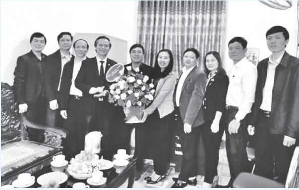
Lãnh đạo huyện tặng hoa chúc mừng Huyện đoàn Hương Sơn