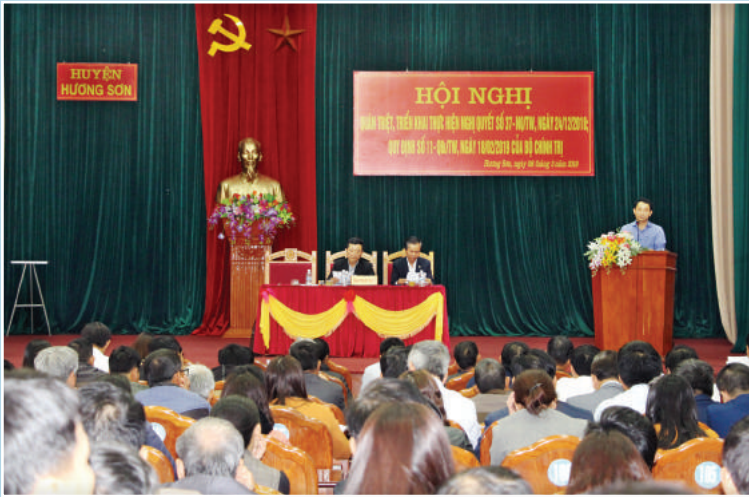
Hội nghị quán triệt Nghị quyết số 37 và Quy định số 11 của Bộ Chính trị