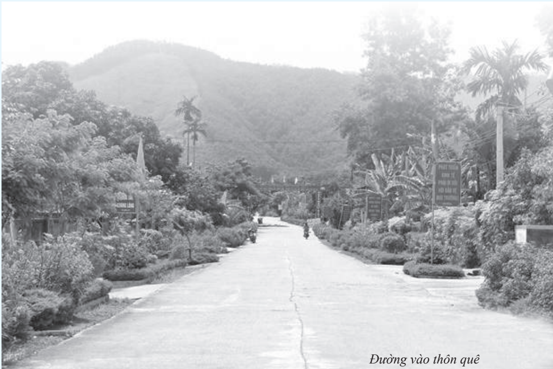
Đường vào thôn quê

*. Tên các địa danh chính vòng quanh huyện Hương Sơn