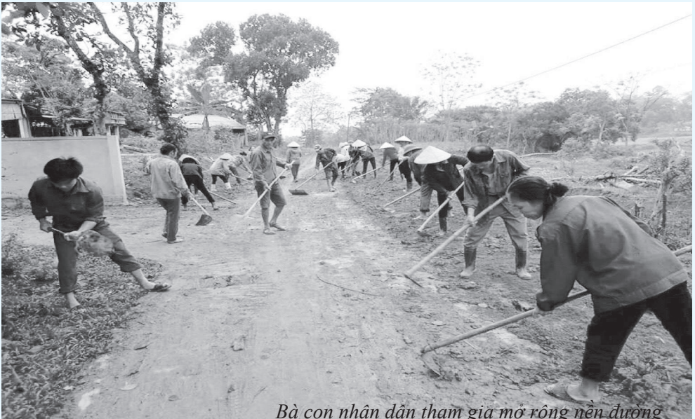
Bà con nhân dân tham gia mở rộng nền đường

Sơn Lĩnh là xã thuần nông, đời sống nhân dân chủ yếu dựa vào sản xuất nông nghiệp, ngành nghề phụ ít, thương mại dịch vụ nhỏ lẻ nên kinh tế của đa số bà con nhân dân vẫn còn gặp rất nhiều khó khăn, bước vào thực hiện Chương trình xây dựng NTM, các tiêu chí của xã đều ở mức thấp. Tuy nhiên, ngay từ đầu, Cấp ủy, chính quyền xã đã nhận thức rõ xây dựng NTM là một chương trình tổng thể để phát triển kinh