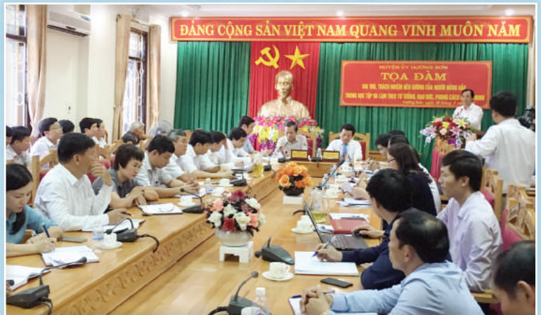
Toàn cảnh tọa đàm “Trách nhiệm nêu gương người đứng đầu trong học tập và làm theo tư tưởng, đạo đức, phong cách Hồ Chí Minh”