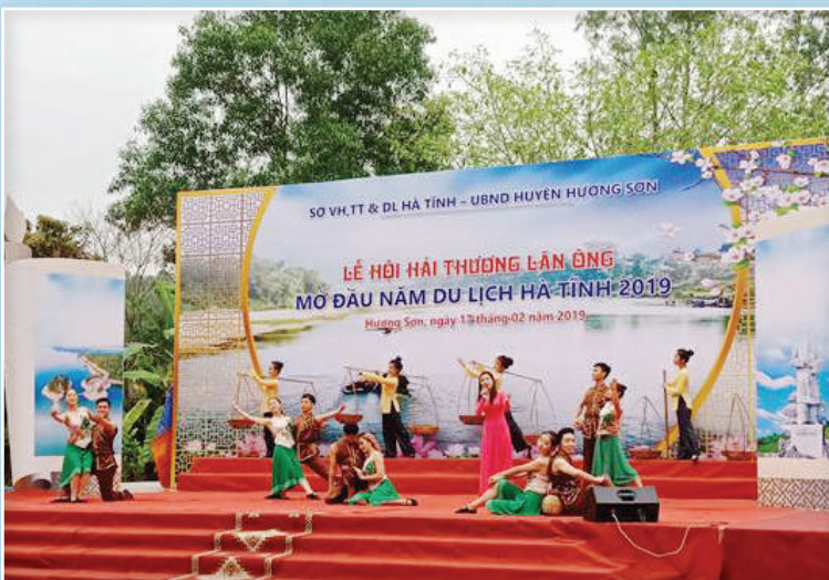
Lễ hội Hải Thượng Lãn Ông - mở đầu năm du Lịch Hà Tĩnh