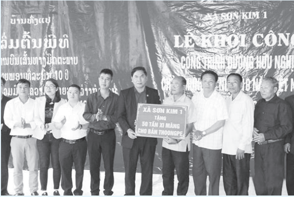
... tặng 50 tấn xi măng cho bà con Thoang Pẹ.

trạm quân y kết hợp bản Thoang Pẹ khám đo huyết áp, tim mạch và các bệnh ngoài da; hướng dẫn cho người dân giữ gìn vệ sinh bản thân, phòng chống, ngăn ngừa dịch bệnh cho 150 lượt người. Trong đợt này, Đoàn cũng đã trao tặng 100 cái màn chống muỗi, 50 chiếc võng cho các hộ gia đình nghèo và trao 2 tạ giống lúa TH 3-5; hỗ trợ 50 tấn xi măng. Đây là những hoạt động thể hiện tinh đoàn kết gắn bó giữa hai dân tộc Việt Nam và Lào, góp phần giúp người dân Bản Thoang Pẹ nâng cao ý thức phòng bệnh, giúp các hộ nghèo giảm bớt khó khăn, ổn định cuộc sống.