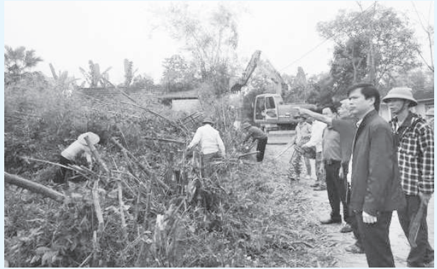
Đ/c Trần Bình Thân, PCT UBND huyện trực tiếp xuống kiểm tra, chỉ đạo xã làm giao thông nông thôn

Trong đợt ra quân lần này, toàn xã hoàn thành 60% chỉ tiêu kế hoạch cứng hóa đường giao thông, rãnh thoát nước, kênh mương nội đồng theo cơ chế hỗ trợ xi măng năm 2019. Trong đó làm 1,2 km đường GTNT, 0,9 km rãnh thoát nước, 0,3