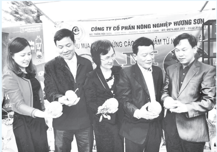
Các đồng chí lãnh đạo huyện nghe giới thiệu về tem truy xuất nguồn gốc sản phẩm trên đặc sản cam bû

Nhằm khuyến khích phát triển sản phẩm, từ ý tưởng và xuất phát từ nhu cầu, khả năng thực tế của mỗi cơ sở sản xuất, chương trình đề ra một “sân chơi”, đó là chu trình OCOP được thực hiện theo các bước với nguyên tắc dân biết, dân làm và