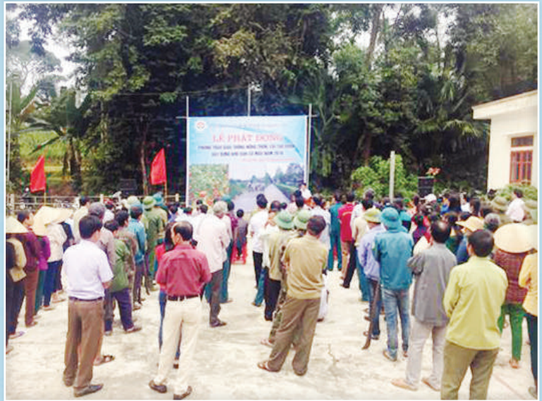
Toàn cảnh buổi lễ ra quân 2 phong trào làm GTNT và cải tạo vườn tại xã Sơn phúc