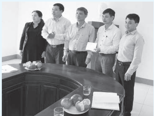
Trực tiếp trao quà hỗ trợ xã Sơn Bình