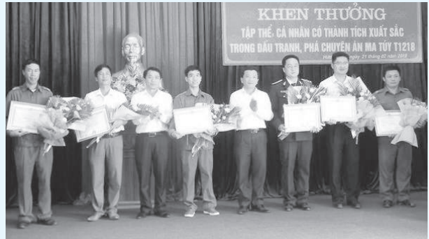
Trao thưởng các tập thể, cá nhân có thành tích xuất sắc trong đấu tranh tội phạm ma túy

phần đấu tranh thắng lợi chuyên án, ổn định tình hình an ninh trật tự trên địa bàn. Bí thư Huyện ủy cũng yêu cầu công an huyện và các lực lượng tiếp tục phối hợp mở rộng điều tra chuyên án, xử lý nghiêm các đối tượng. Đồng thời, chủ động nắm