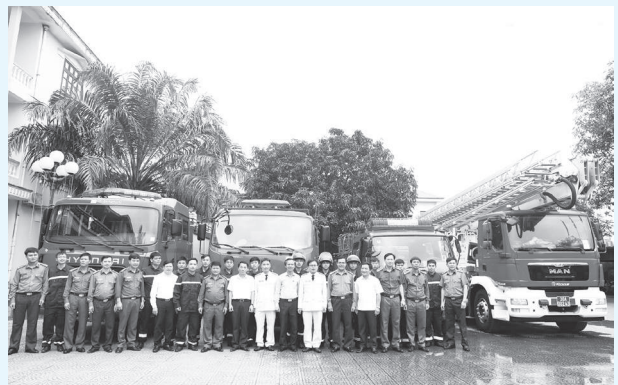
Bàn giao xe và trang thiết bị làm việc cho Đội PCCC&CNCH thuộc Công an huyện Hương Sơn...

định điều động 16 cán bộ, chiến sĩ từ Phòng Cảnh sát PCCC&CNCH và Công an huyện Hương Sơn vào biên chế, trực thuộc Công an huyện. Đội có nhiệm vụ thực hiện công tác quản lý nhà nước trên lĩnh vực PCCC và nắm chắc tình hình, địa bàn đồng thời được giao nhiệm vụ tổ chức thường trực 24/24h để tiếp nhận và xử lý thông tin về cháy, nổ và cứu nạn, cứu hộ; tuyên truyền về phòng, chống