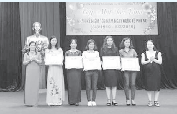
Khen thưởng cho tập thể, cá nhân trong phong trào thi đua “Giỏi việc nước, đảm việc nhà”

* LĐLĐ huyện tổ chức gặp mặt tọa đàm 8/3: Chiều ngày 06/3, Liên đoàn Lao động huyện tổ chức gặp mặt tọa đàm cán bộ Chủ tịch