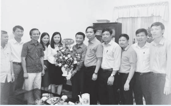
Lãnh đạo huyện tặng hoa chúc mừng HLHPN huyện

Thay mặt lãnh đạo huyện, đồng chí Bí thư đã ghi nhận và đánh giá cao những kết quả mà cán bộ, hội viên Hội LHPN huyện và mong muốn trong thời gian tới, Ban Thường vụ Hội LHPN huyện tiếp tục nỗ lực, phấn đấu hoàn thành xuất sắc các nhiệm vụ được giao, góp phần cùng Đảng bộ và nhân dân huyện hoàn thành và vượt các chỉ tiêu đã đề ra.