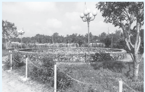
Nhân dân và con em xã quê đóng góp tiền và ngày công tôn tạo Giếng làng