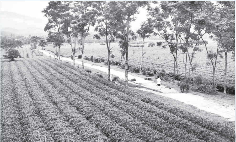
Những triền Chè VietGap ở Hương Sơn

HĐND tỉnh Hà Tĩnh ban hành Nghị quyết số 123/2018/NQ-HĐND và huyện Hương Sơn ban hành Nghị quyết số 85/2018/NQ-HĐND về một số chính sách khuyến khích phát triển nông nghiệp, nông thôn gắn với xây dựng nông thôn mới, đô thị văn minh, trong đó có nhiều nội dung hỗ