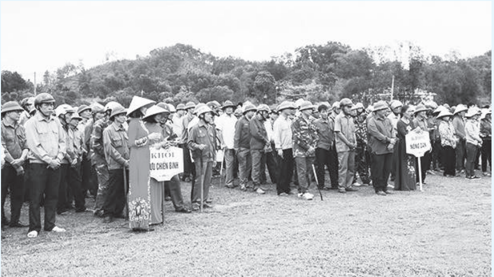
Ủy ban MTTQ huyện Hương Sơn tổ chức lễ phát động ra quân xây dựng NTM, đô thị văn minh năm 2019.

Nhiệm kỳ qua, việc đẩy mạnh cuộc vận động “Toàn dân đoàn kết xây dựng đời sống văn hóa ở khu dân cư” giai đoạn 2014 - 2015 và cuộc vận động “Toàn dân đoàn kết xây dựng Nông thôn mới, đô thị văn minh” từ 2016 đến nay, gắn với “ngày thứ 5 về cơ sở”, “Ngày thứ 7 đồng hành Nông thôn mới” được triển khai sâu rộng. Với 5 nội dung và những tiêu chuẩn cụ thể, cuộc vận động đã mở rộng và nâng cao chất lượng gắn với chương trình